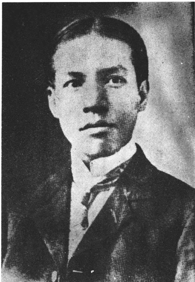
三十一歲時的梁啓超