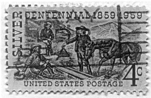
内华达州发现银矿纪念邮票 1873年美国内华达州发现大银矿，之后白银迅速贬值

美国建国后不久，1792年财政部规定，任何人只要携带金银就可以到铸币厂自行铸币。247.5克黄金可以换得10美元金币，371.25克白银可以换得1美元银币，黄金白银比价是1：15。