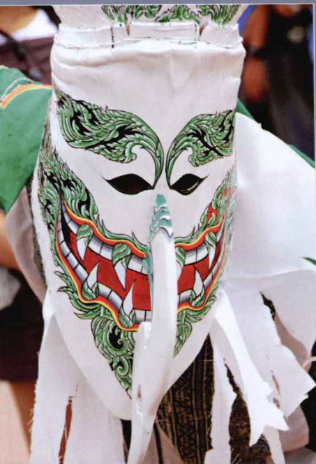
14 鬼脸节(Phee Ta Khon Festival)丹赛镇节日，届时戴着傩面具的人们会一路跳着舞，穿街过巷。（见第253页）