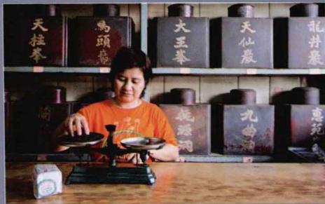
15 曼谷唐人街(Bangkok's Chinatown)这是曼谷市内最早的商业中心，这里的市集已有两百多年历史。（见第76页）