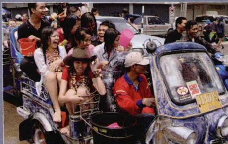
16 宋干节(Songkran)泰历新年(Thai New Year)，届时将有盛大的街头泼水活动。（见第14页）