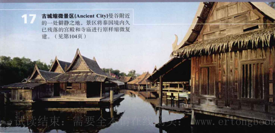
17 古城缩微景区(Ancient City)曼谷附近的一处僻静之地，景区将泰国境内久已残落的宫殿和寺庙进行原样缩微复建。（见第104页）