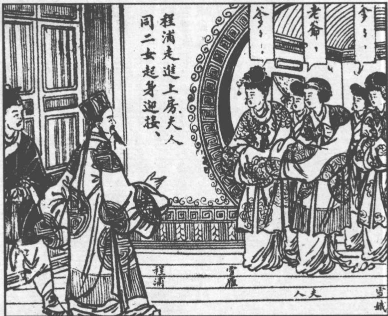
139. 夫人同二个女儿来见程浦。