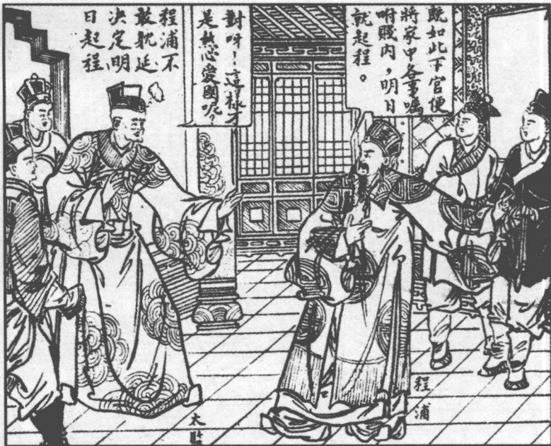
137. 程浦決定明日起程。