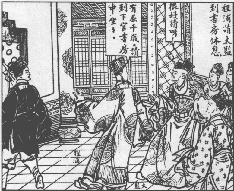
138. 程浦請太監到書房休息。