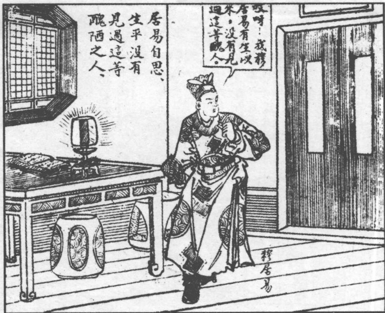
127. 穆居易对“雪娥”的丑陋十分反感。