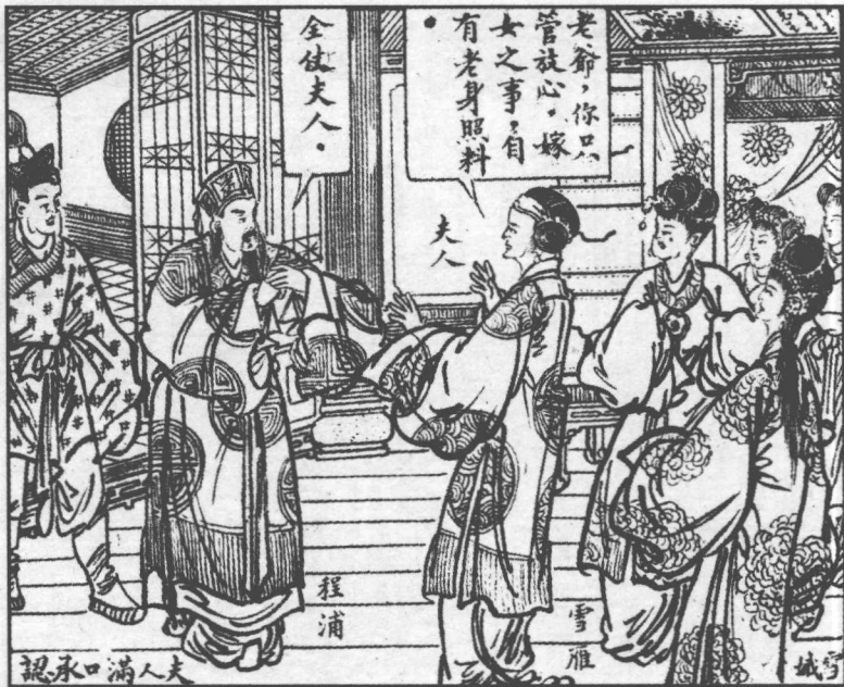
141. 夫人满口应承下来。