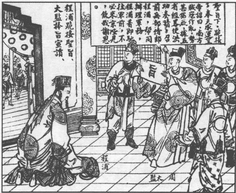
135. 太监宣旨领兵平寇。