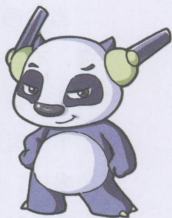
龙江一号 昵称：盼盼

我是一个为未来阳阳的第八代子孙、历史学家韩博士搜集历史资料的人工智能时空穿梭机器人，来自2261年。在一次采集任务完成后意外坠落到2011年，却发现历史被改变了。被改变的历史是什么呢？进入故事中寻找答案吧！