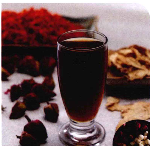
药材不同，药效亦异

药酒作为一种能有效改善人体素质、提高抗病能力、防病祛病、延缓衰老、益寿延年、价廉省时、安全可靠、见效快、疗效高的保健制剂而受到大众的欢迎。