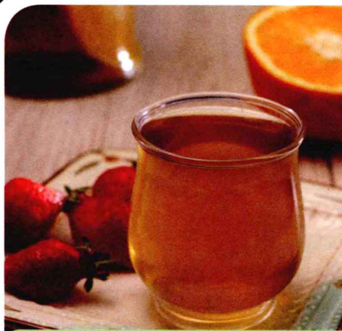
病症不同，药效亦异

药酒能增强人体的免疫功能和抗病能力，坚持服用保健药酒，能保持人的旺盛精力，延长人的寿命；而且对于治疗内科、妇科、儿科、骨伤科、外科、皮肤科、眼科和耳鼻喉科等各科 190 多种常见病和部分疑难病症效果显著。举例如下：