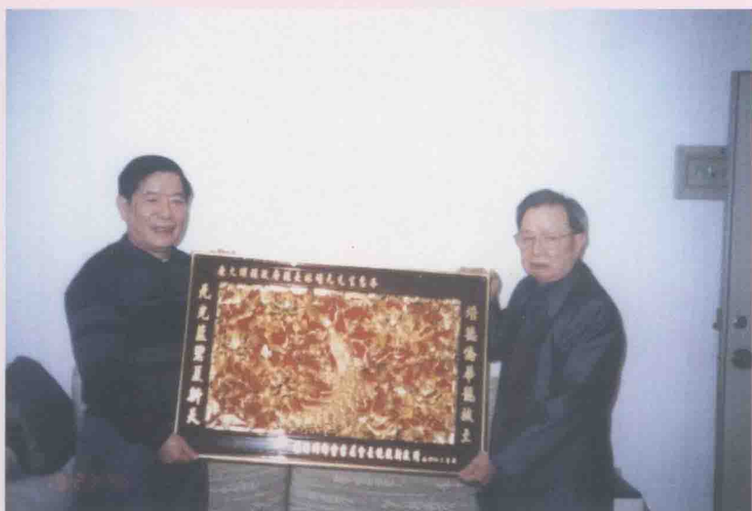
旅港大埔同乡会饶竞新会长（右）赠送作者（左）的“龙凤呈祥”金雕牌匾。