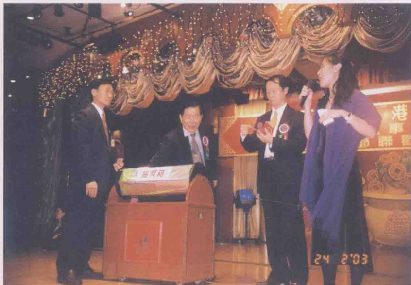
2003年2月24日，在旅港大埔同乡会换届庆典晚会上，作者（左二）登台为大会抽特等奖。