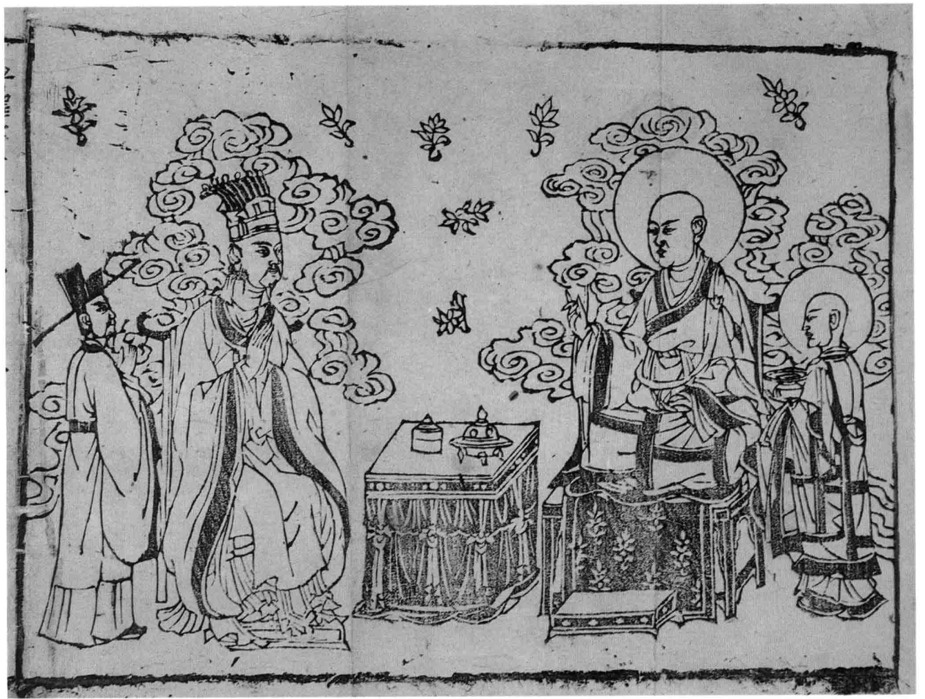
六 TK186 注清涼心要版畫

入於海周公謂魯公曰君 不施其親不使大臣怨 不以故舊無大故則不 也無求備於一人周有 士伯達伯适仲突仲忽 夜叔夏季隨季驄