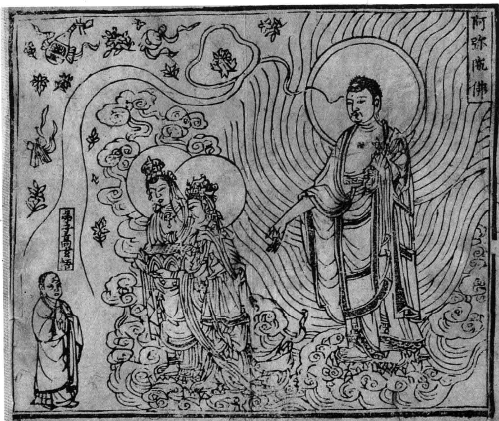
九 TK244 阿彌陀佛版畫