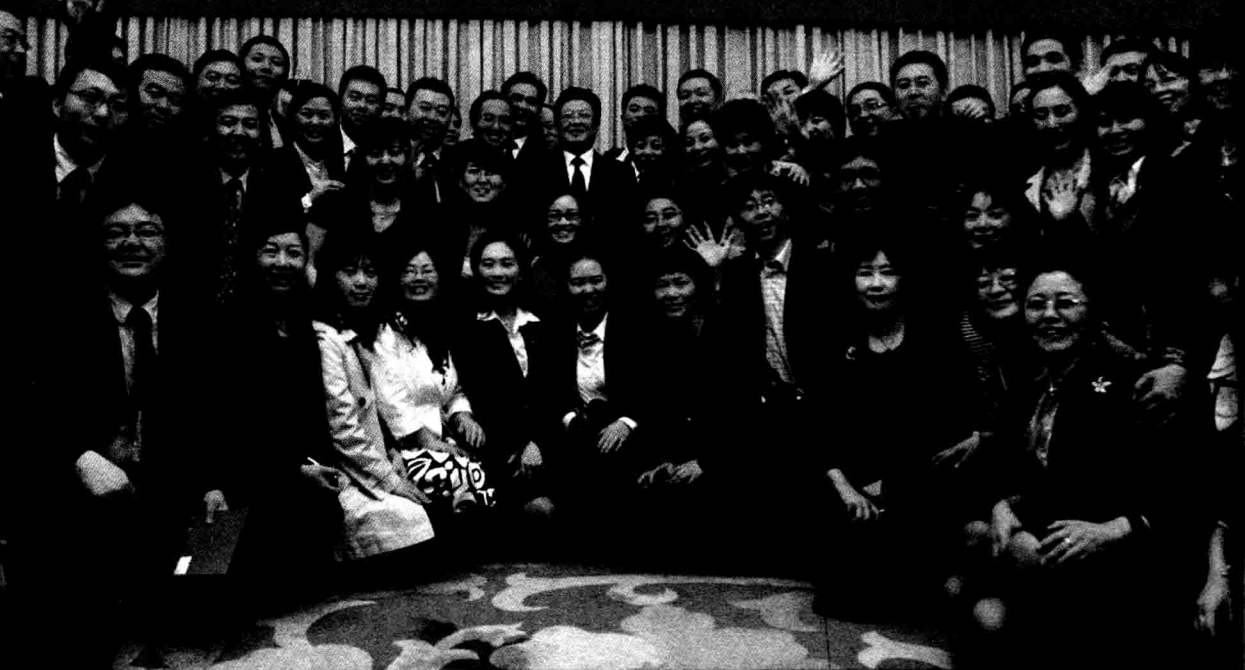
2011年4月25日,中共中央政治局委员、全国人大常委会副委员长王兆国出席中国青年报创刊60周年座谈会,并与青年编辑记者合影留念。