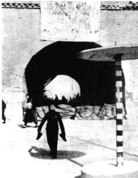
西安钟楼墙上的抗日漫画（1936年）