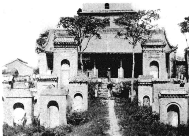
大雁塔题名碑近景（1933年）