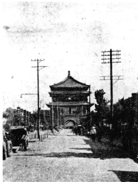
战乱后的钟楼远景（1947年）