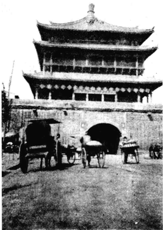
钟楼的门洞曾是西安的交通枢纽（1932年）