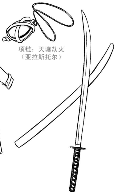
项链：天壤劫火 (亚拉斯托尔)