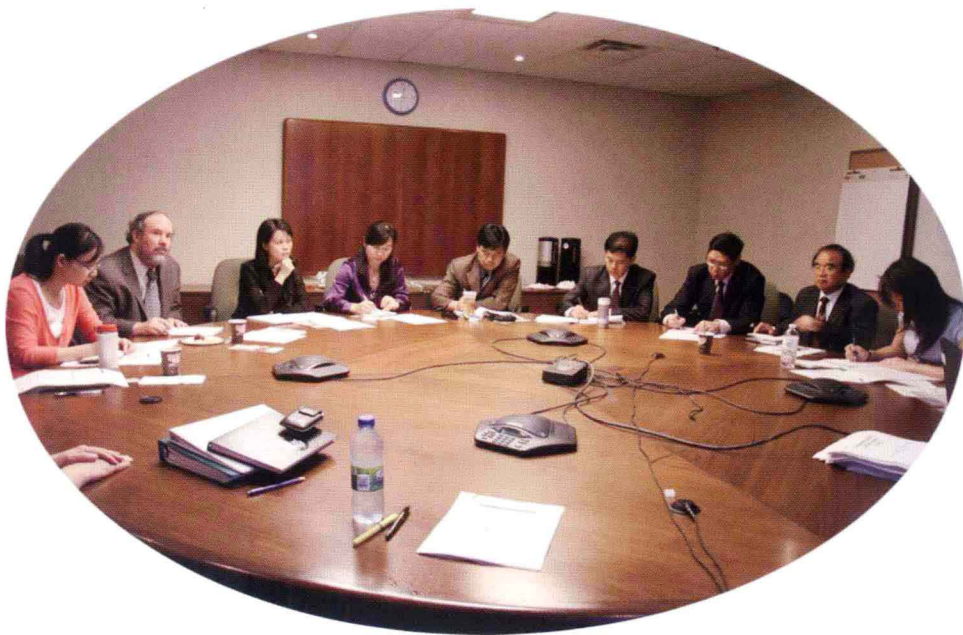
在安大略省劳动部听取情况和经验介绍