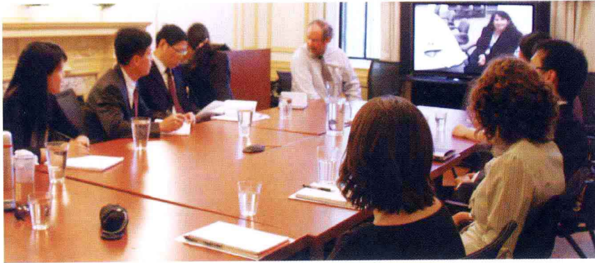
在蒙特利尔麦基尔大学举行视频报告会，研讨劳动就业和工资问题