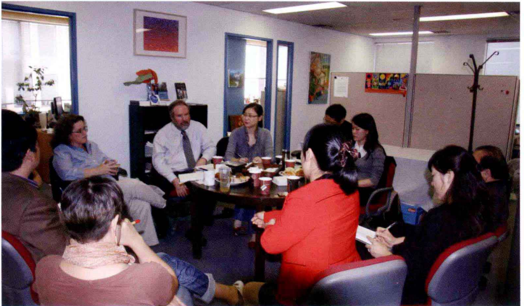
在温哥华某基金会座谈就业性别平等问题