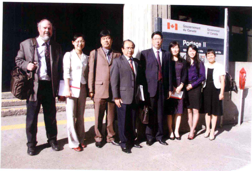
在加拿大联邦人力资源和技能发展部考察