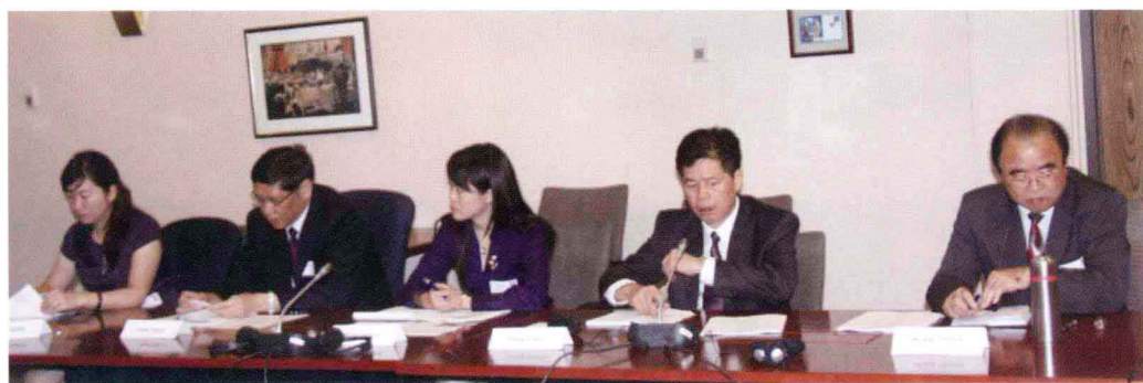
在加拿大人力资源和技能发展部考察