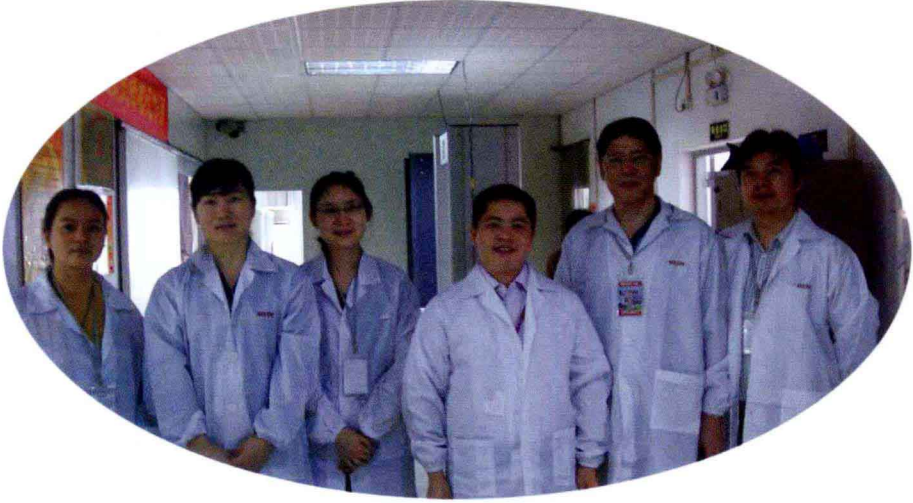
在广州市某企业考察生产和人力资源管理情况