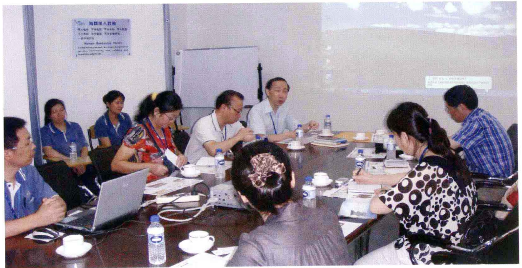
在广州市某企业调研