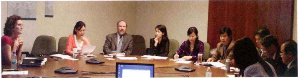
在安大略省劳动部听取情况介绍