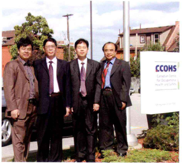
在汉密尔顿加拿大职业健康与安全中心