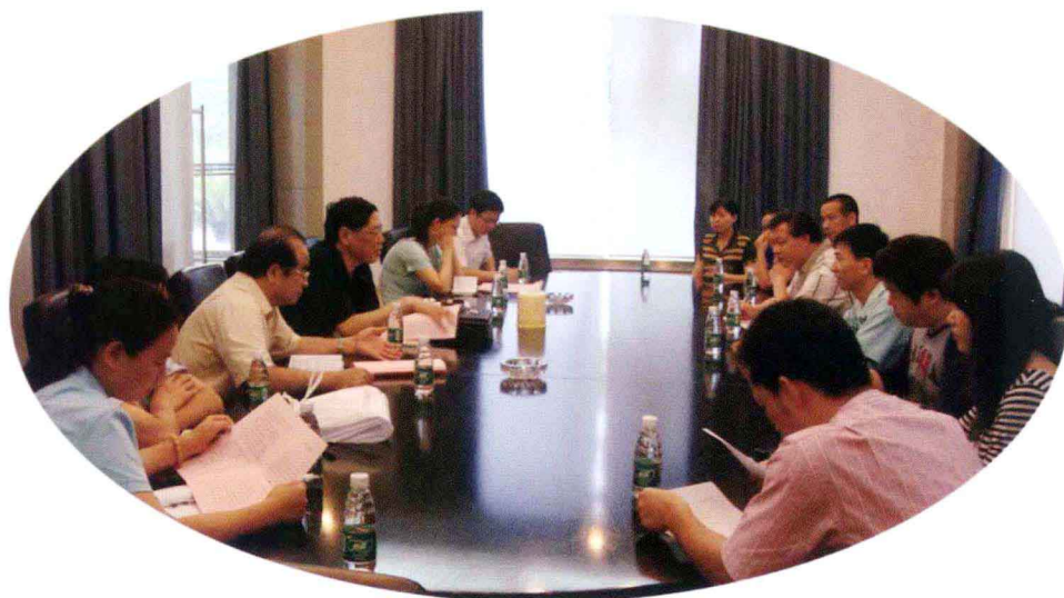
项目组成员同企业员工座谈对话