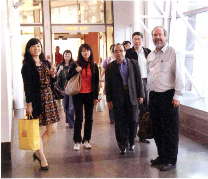
从蒙特利尔赶往下一个考察点