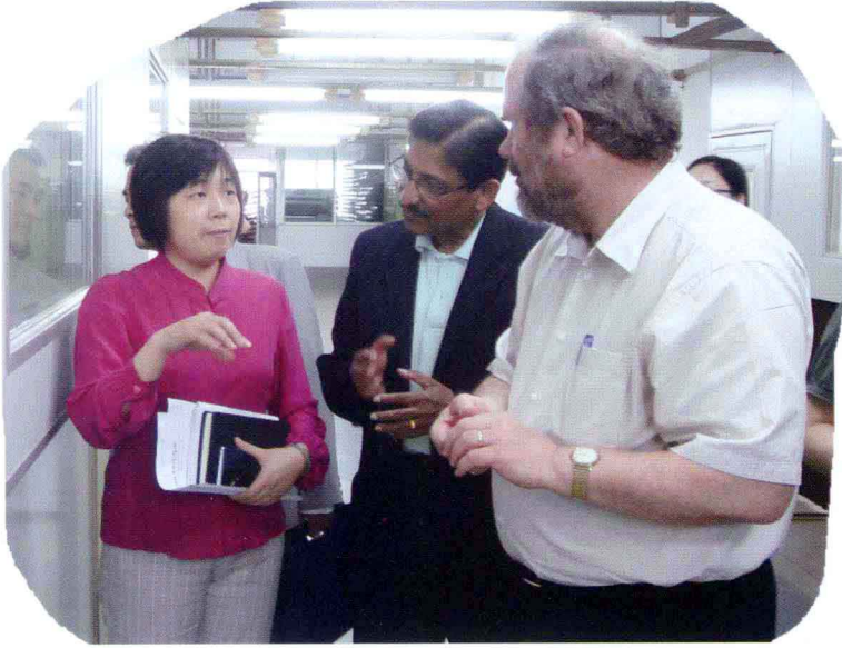
在广州珠江钢琴厂询问劳工权益情况