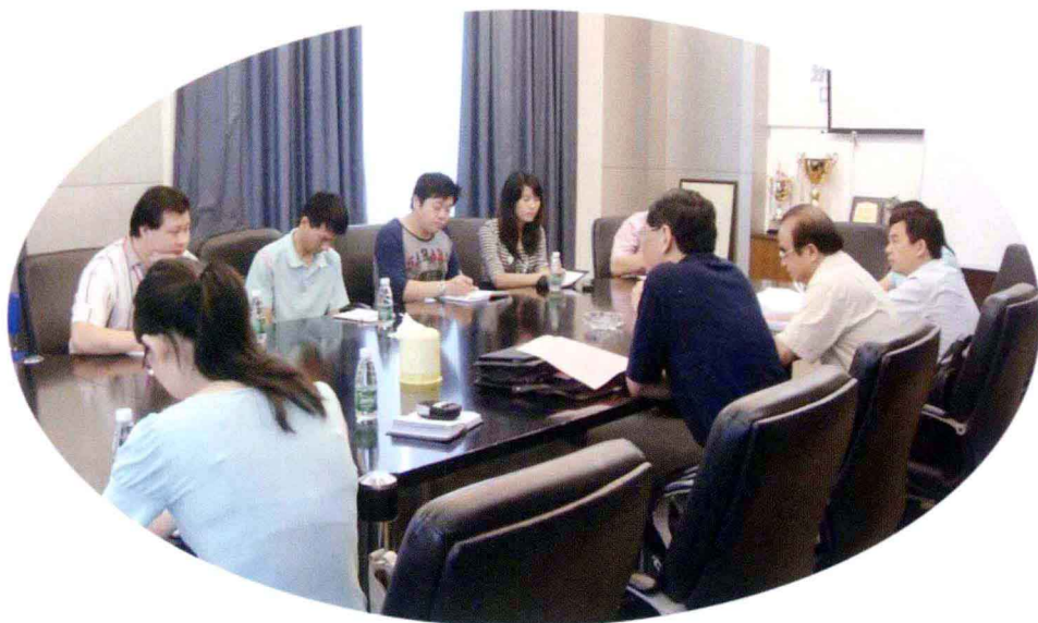
在东莞市某企业同员工座谈劳动权益