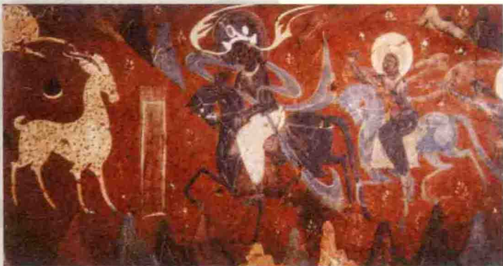
《鹿王本生故事》莫高窟壁画（北魏）

夏、商、西周及春秋、战国时期，绘画已有了相当的进步。古籍中已出现有关绘画活动的记载，如周代宫廷及明堂中已有历史人物的画像，春秋时楚先王庙及卿祠堂中也绘有历史、神话等内容的大型壁画。在河南安阳商代殷墟遗址及陕西扶风