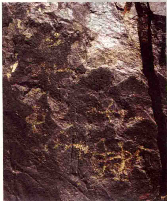
狩猎 内蒙古阴山岩画

早期绘画 中国绘画的最早遗迹可上溯到远古的岩画和繁荣于新石器时代彩陶器上的非常丰富的装饰纹样，20世纪80年代在甘肃秦安大地湾原始房屋的地上发现绘有人物和动物的绘画残迹；辽宁西部凌源、建平交界处之牛河梁发现属于红山文化的女神庙遗址，出土有彩绘墙壁残块，为最早的壁画。新石器时代的绘画，技巧上虽尚处于稚拙阶段，但已具有初步造型能力，对人物、鱼、鸟等外形动态亦能抓住主要特征，并表现出作者的信仰、愿望，用以美化生活，犹如一片绚丽的彩霞，映现了中国绘画史的黎明。