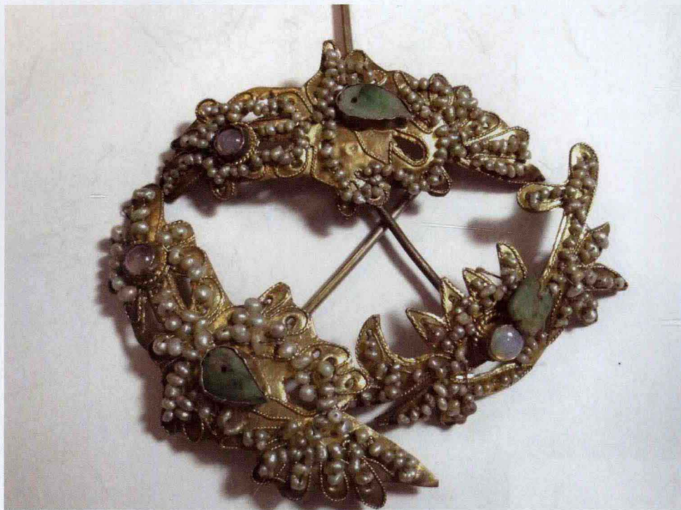
图 1-2 古代珍珠发钗 (二)