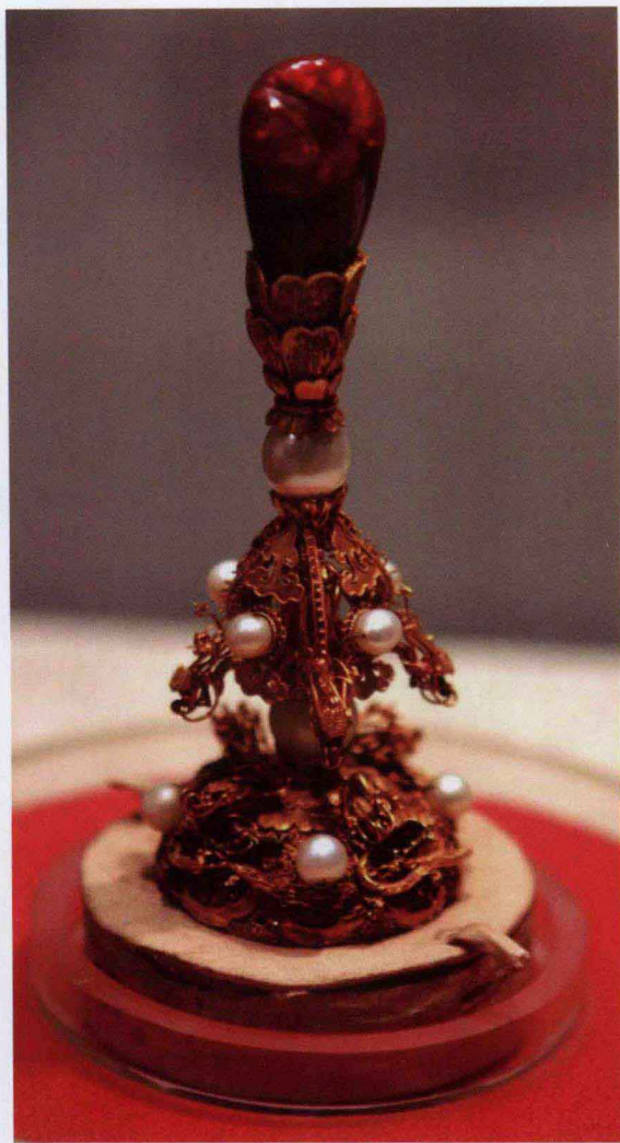
图 1-7 清朝金嵌珍珠帽顶