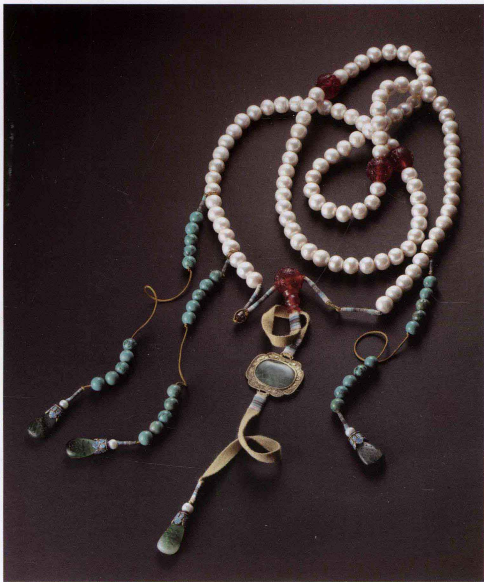
图 1-5 清朝珍珠朝珠（二）