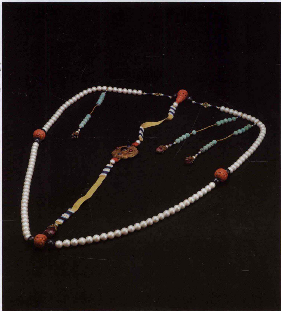
图 1-4 清朝珍珠朝珠（一）