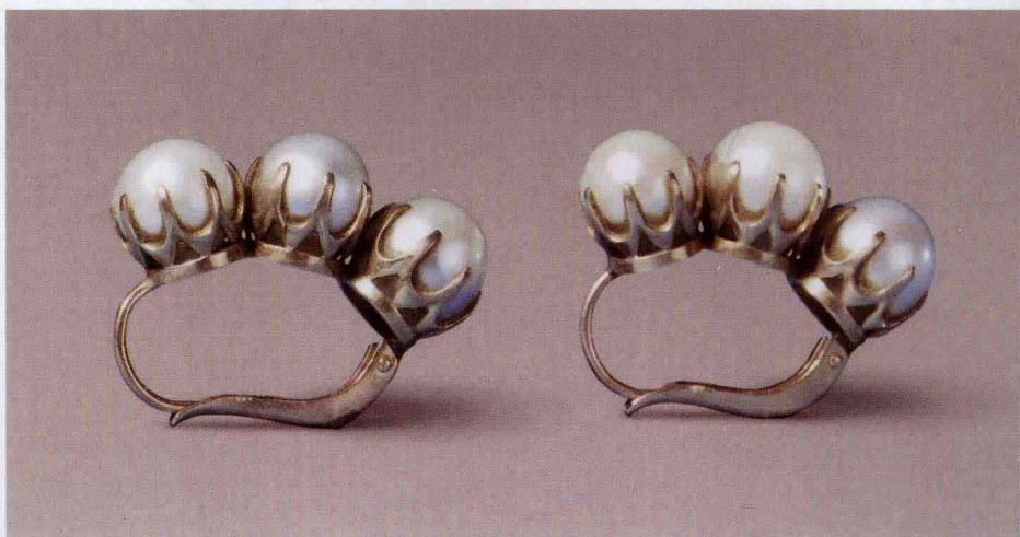
图 1-3 古代珍珠耳饰