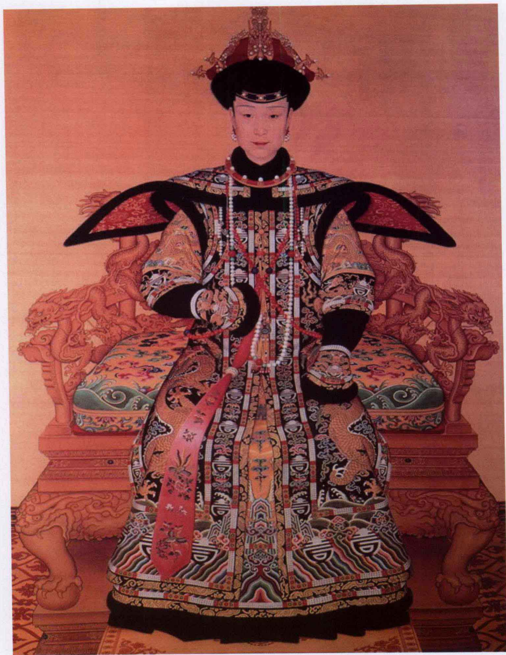
图 1-6 清朝乾隆帝慧贤皇贵妃佩戴朝珠像 (北京故宫博物院藏)