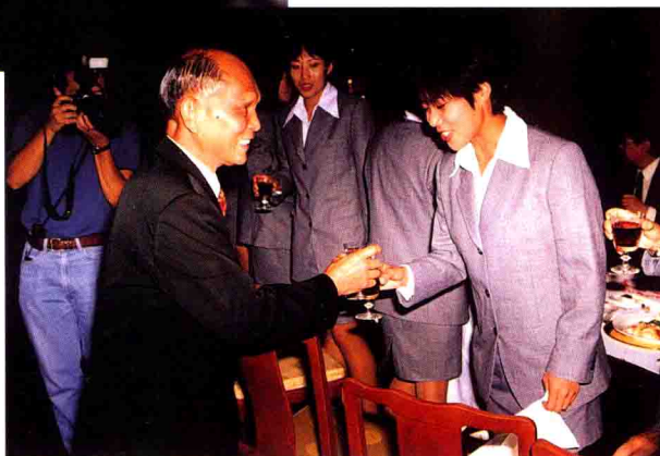
范运杰：谢谢霍先生！感谢您对女足的关爱。