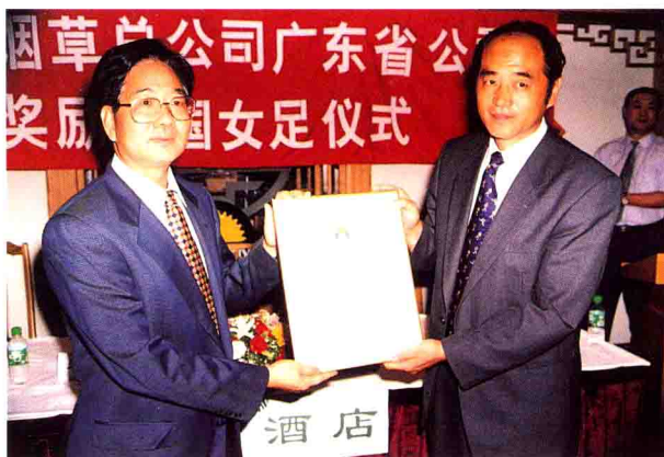
中国女足又获国内企业支持。