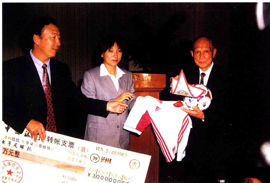
霍英东先生奖给中国女足 300 万元人民币。