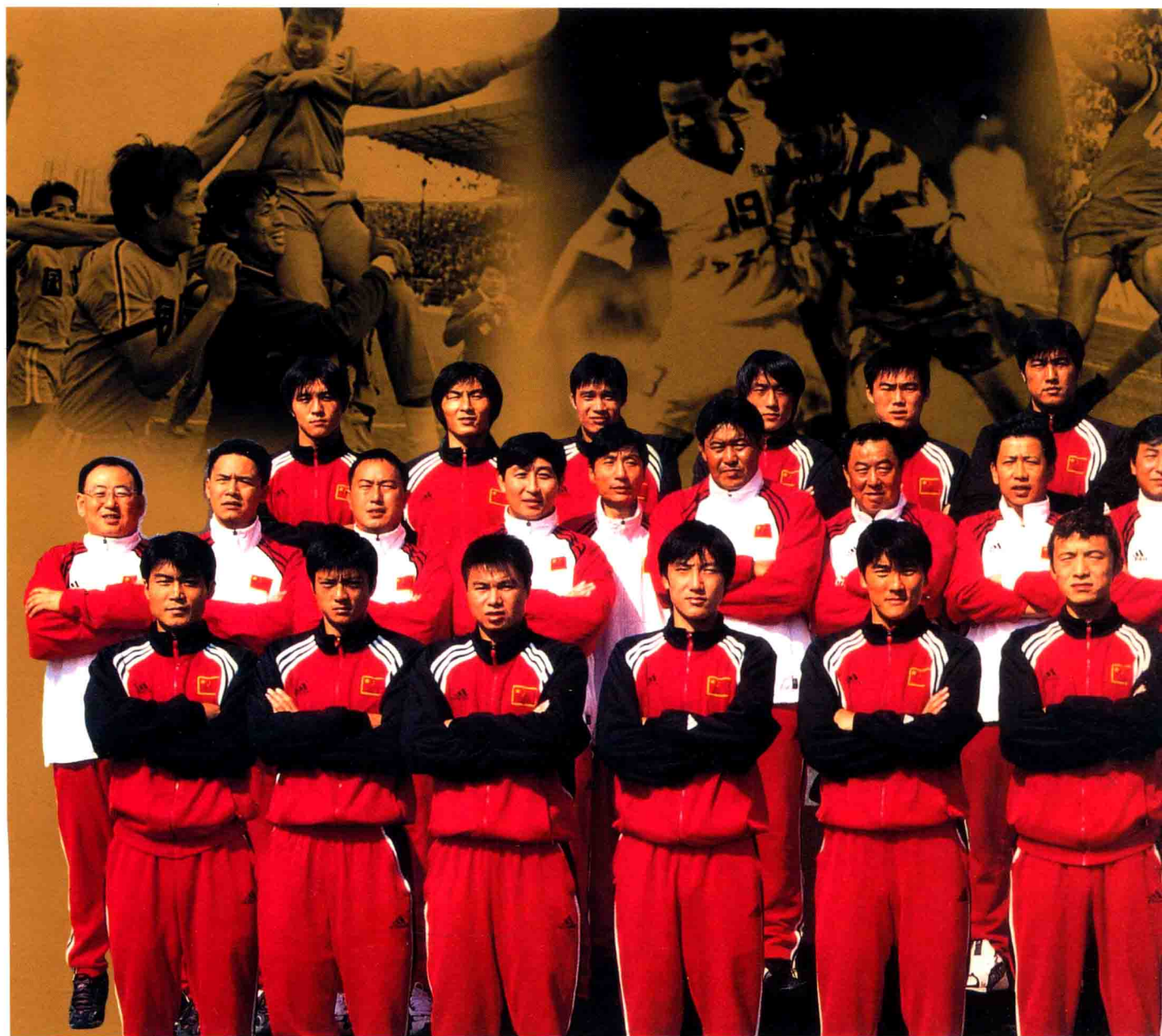
2001年10月7日，中国足球队的小伙子们踏着先人的足迹走向成功。