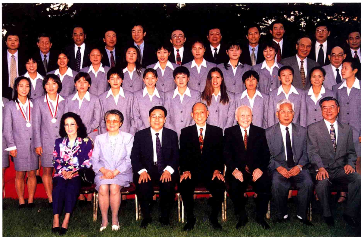
霍英东先生接见中国女足姑娘