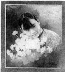
上海北四川路友联印刷公司行