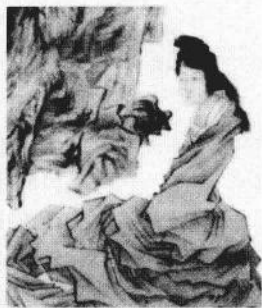
●女媧补天图 清 任颐