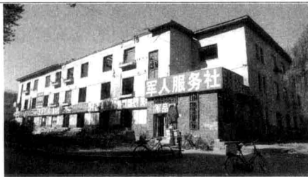
2005年10月8日，拆前的“八大舍”之最后小楼