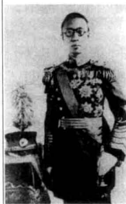
伪满洲国“皇帝”溥仪