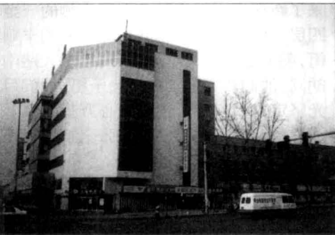
2001年4月6日的友谊商店（今自由大路1270号，原报社社位置）

上个世纪90年代初期至中期，长春友谊商店（今长春国贸友谊店）的兴起，使这一带空前繁荣起来。至今还在自由大