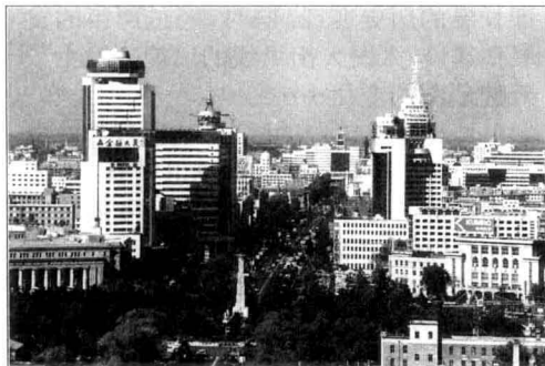
今天的人民大街