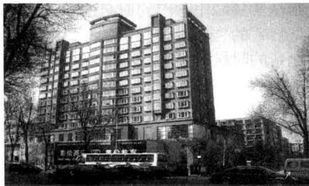
如今，旧址上建起的招商银行办公大楼