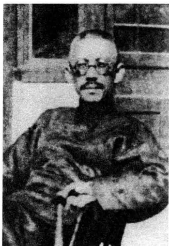
顾随先生，1941年冬摄于北平碾儿胡同寓所