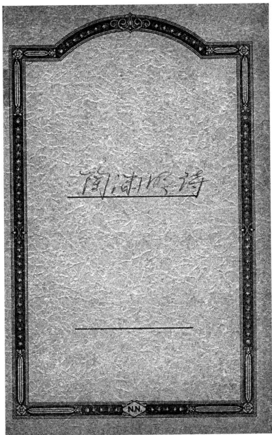
叶嘉莹上个世纪40年代听课笔记封面