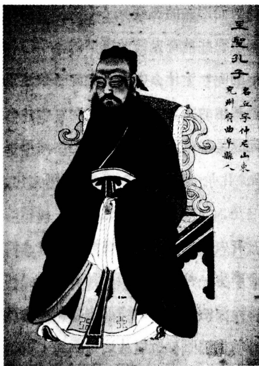
中国圣人孔子（网上图片）

就是一种占卜的文字，是在崇拜鬼神的宗教活动中产生出来的。殷商时代的文化特点是“尊神事鬼”，这是孔子说的，孔子离那个时代不远，只隔了几百年的时间。孔子曾把殷人与周人做了比较，他认为殷人的特点是尊神事鬼，而周人的特点是尊礼敬德。尊神事鬼是对鬼神的崇拜，而尊礼敬德就是对宗法礼仪的尊崇。从殷商到西周的这种文化变化，可以说是中国古代文化史中的一个重要契机。从这以后中国文化就开始走上了一种形而下的道路，一条入世的道路，注重人与人之间的伦理关系和宗法制度，而不太关心人与神之间的虚无缥缈的关系。