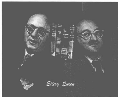
埃勒里·奎因 Ellery Queen