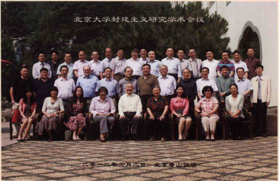
北京大学“封建主义研究学术讨论会”与会学者合影