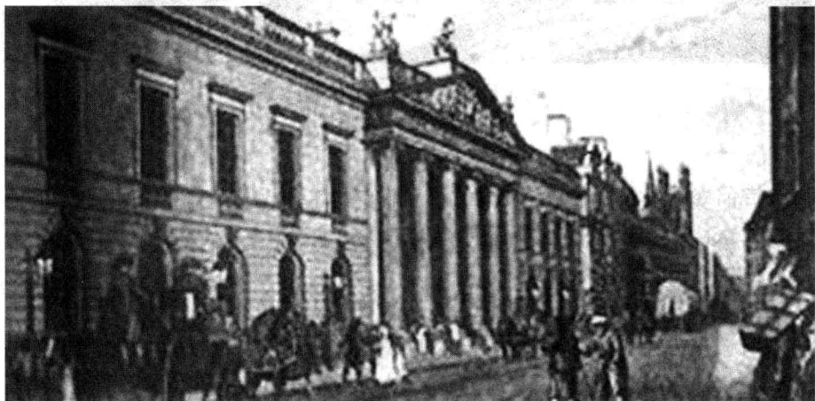
1600年，英国东印度公司成立

案件，中国官吏不愿过问，那就是说，自动地放弃境内的法权。譬如，乾隆十九年（1755年），一个法国人在广州杀了一个英国人，广州的府县最初劝他们自己调解，后因英国坚决要求，官厅始理问。中国人与外国人的民事案件总是由双方设法和解，因为双方都怕打官司之苦。倘若中国人杀了外国人，官厅绝不偏袒，总是杀人者抵死，所以外国人很满意。只有外国人杀中国人的案子麻烦，中国人要求外人交凶抵死，在十八世纪中叶以前，外人遵命者多，以后则拒绝交凶，拒绝接受中国官厅的审理，因为他们觉得中国刑罚太重，审判手续太不高明。