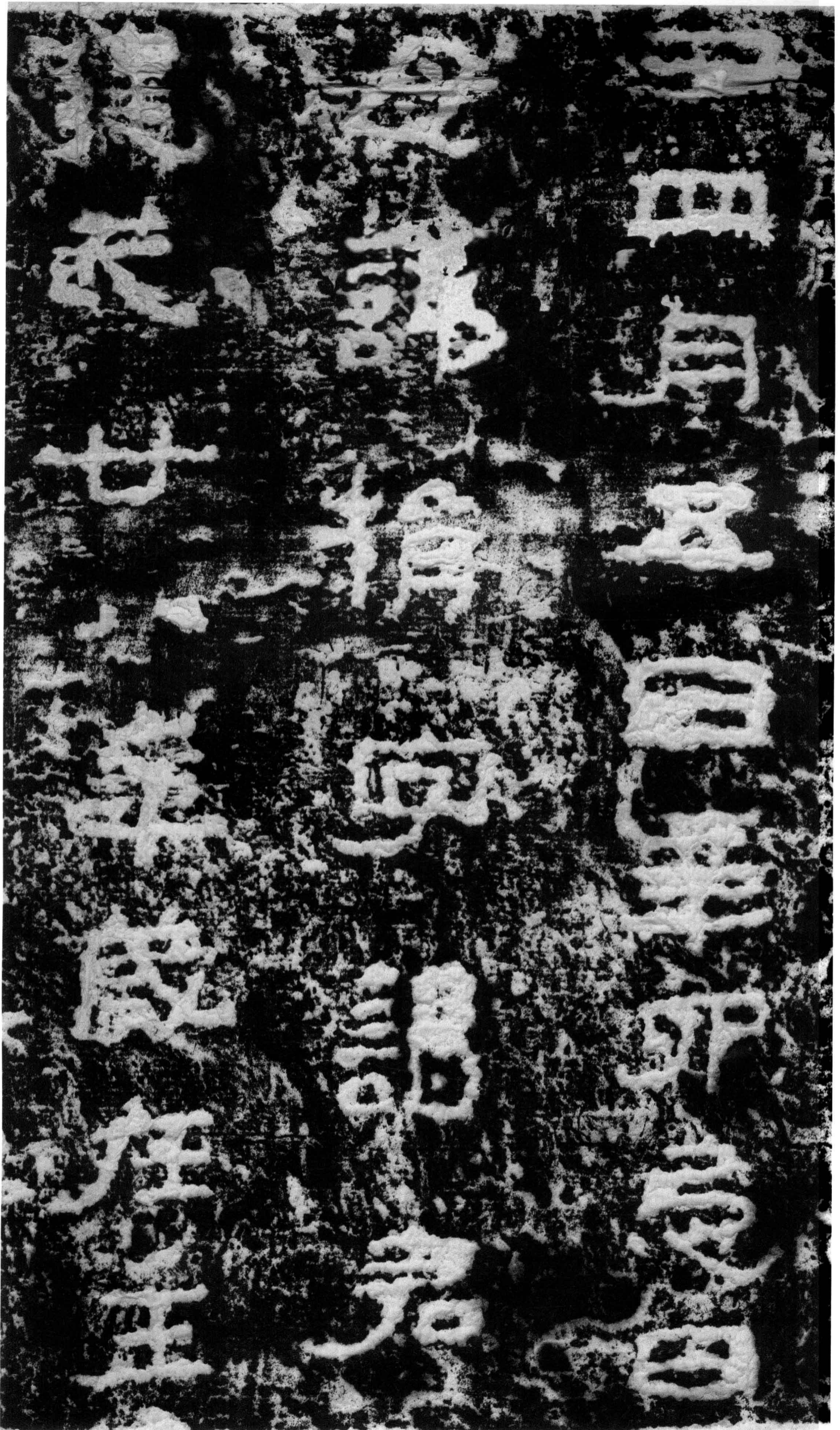
丑四月五日辛卯忌日 母讳捐字渴君 建武廿八年岁在壬