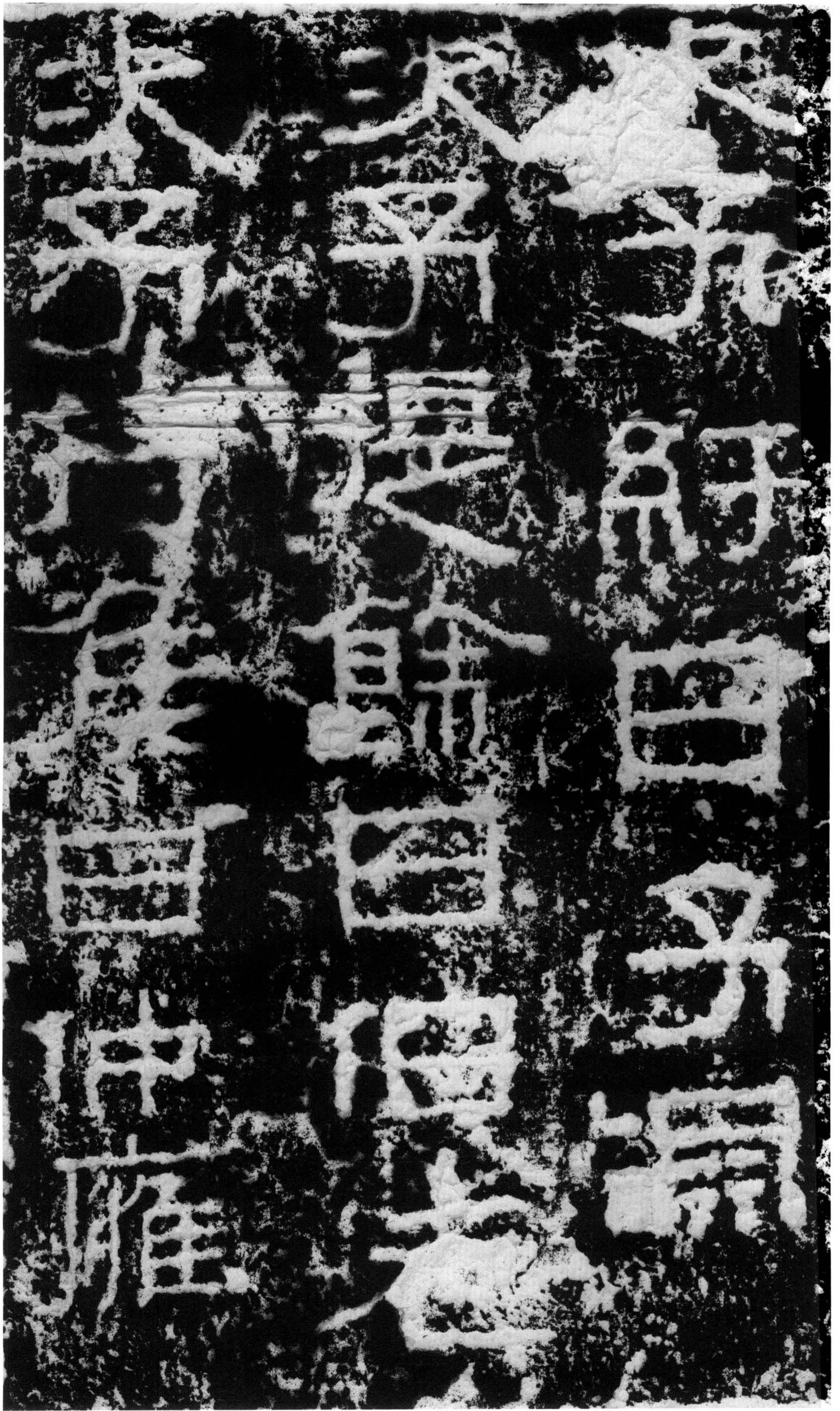
次子紆曰子淵 次子提餘曰伯老 次子持侯曰仲雍