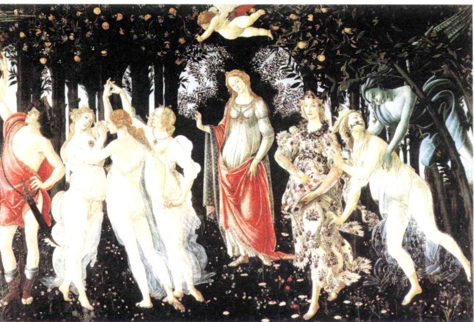
桑德罗·波提切利 《春》 板上蛋彩 203 cm×314 cm 1482 年