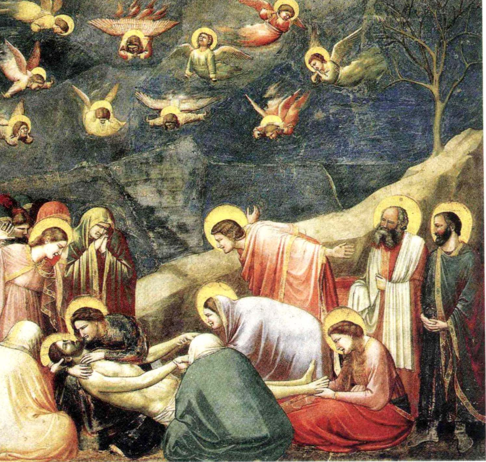
乔托·迪·邦多纳 《哀悼基督》 壁画 200 cm×185 cm 1304—1306 年