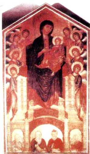
契马布耶 《圣特里尼塔教堂的圣母像》 1285—1286年

在意大利文艺复兴之前的中世纪，宗教是人们主要的精神寄托，教皇是欧洲的最高统治者，拥有至高无上的权利。这一时期的艺术，也秉承着为宗教服务的宗旨，一直流行罗马式的风格，涉及到绘画、雕塑、建筑等。此风格的主要特点在绘画上表现为人物比例拉长、色彩单一，程式化明显：在建筑方面的特点从教堂建筑上可以体现出来，砖石结构的屋顶代替了木质结构的屋顶，厚墙壁，小窗户等，如意大利的比萨建筑群正是罗马式建筑的代表。这一系列的艺术特点都是为了塑造严肃的宗教氛围，表现神权至上的宗教主题。