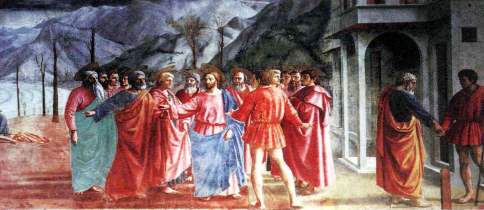
马萨乔 《纳税钱》 壁画 255 cm×598 cm 1426—1428 年

人体以及远近大小时采用了新方法，由此开创了崭新的绘画风格……他是第一个改进绘画方法的画家……他对绘画艺术的再生起了重要作用”。马萨乔将其短暂的一生都奉献给了绘画，为绘画艺术、为文艺复兴开创了一种新的风格，也开启了新的艺术之门。