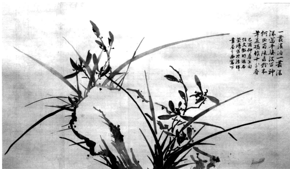
启功高祖载崇的画