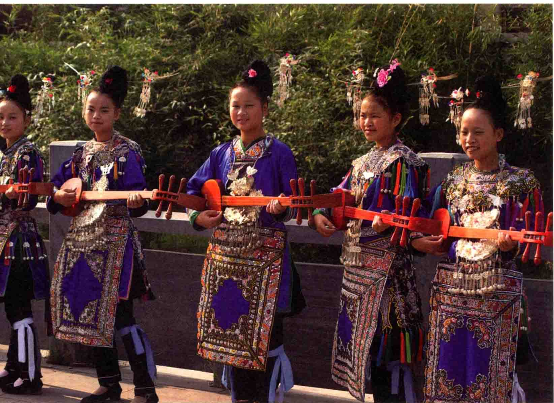
图 1-3 榕江寨蒿晚寨侗女服装