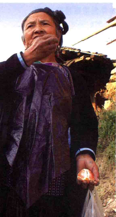
图 1-4 从江小黄侗女肚兜

饰称为孔雀式(图 1-3)。生活在六洞地区的女子服饰以青色衣裙为主,两裙及胸前间有白色点缀,很像喜鹊。当地的群众把这一带女子的服饰称为喜鹊式。四寨河流域一带的女子服饰又是另外一种风格,有点类似古老的和服。四十八寨地区的女子服饰简朴古老,显示出典型的高山地区风貌(图 1-4)。