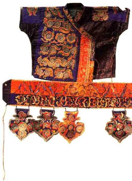
图 1-1 侗族男子古老的芦笙衣

侗族是我国少数民族之一,主要分布在贵州、湖南、广西的交界处。侗族有着悠久的民族历史,淳朴、善良、智慧构成了侗族的文化特色。由于分布范围较为广泛,所处的生活环境及其经济水平差异较大,侗族服饰在款式、质地等方面有较大的差异,各地形成了自己独特的地域服饰特征。贵州侗族服饰十分精美,多以自织、自纺、自染的侗布为材料制作服饰,颜色多倾向于黑、青、白、蓝。侗族服饰色调层次分明,纹样多变,体现出侗族服饰质朴、柔和的服饰特色(图 1-1)。