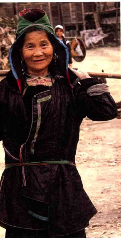
1-2 贵州黎平黄岗侗女服饰