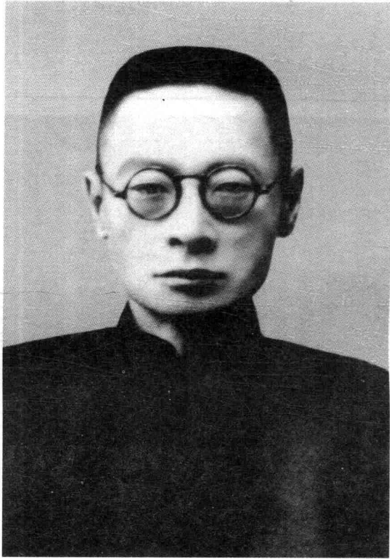
青年時期的劉文典（1927年攝于安慶）