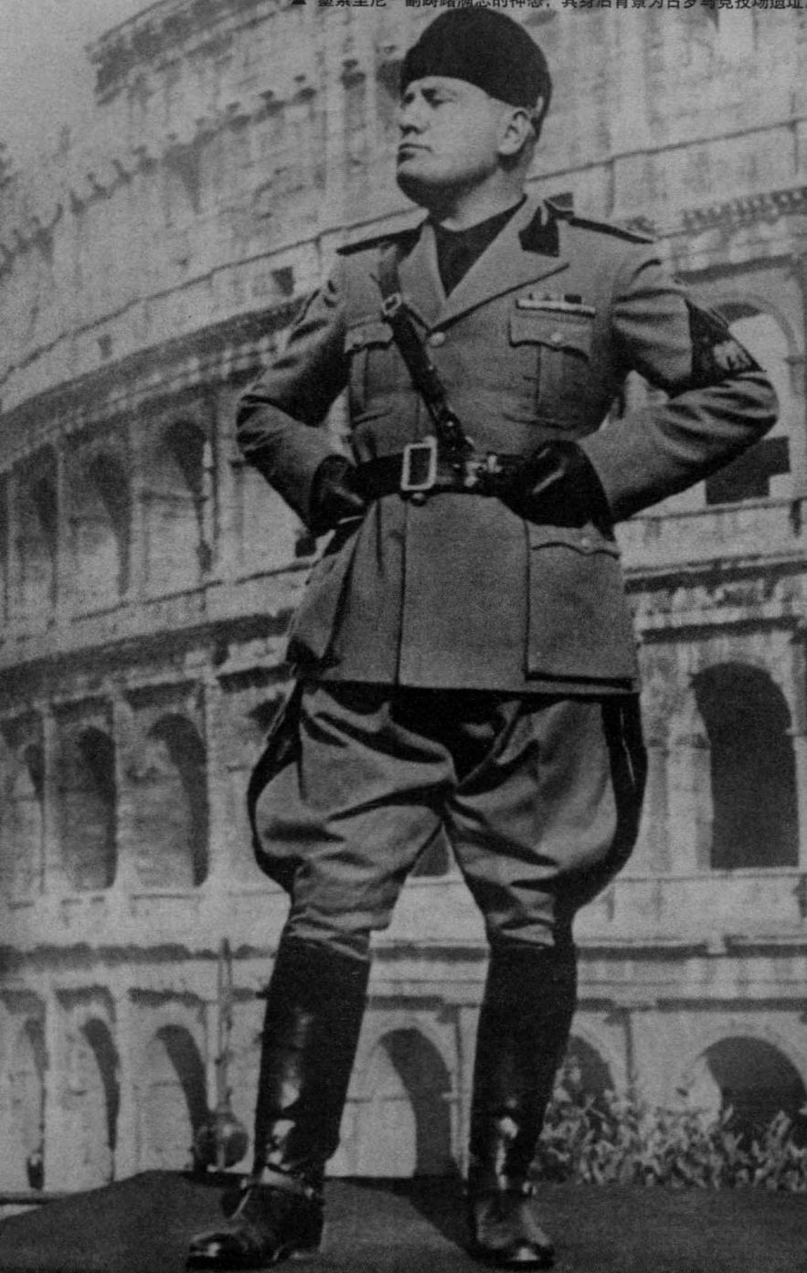
▲ 墨索里尼一副踌躇满志的神态，其身后背景为古罗马竞技场遗址。