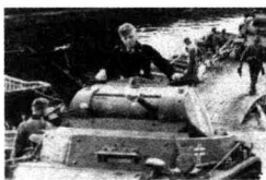
二战经典战役全记录