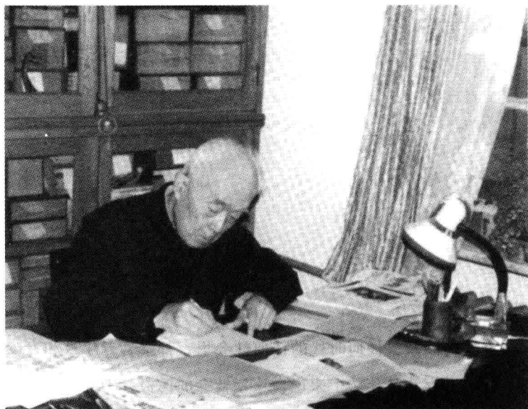
季美林先生在书房工作

结，还必须进一步对“沟”两边的具体情况加以分析。中年这一个中间阶段，我先不说，我只分析老少这两极。