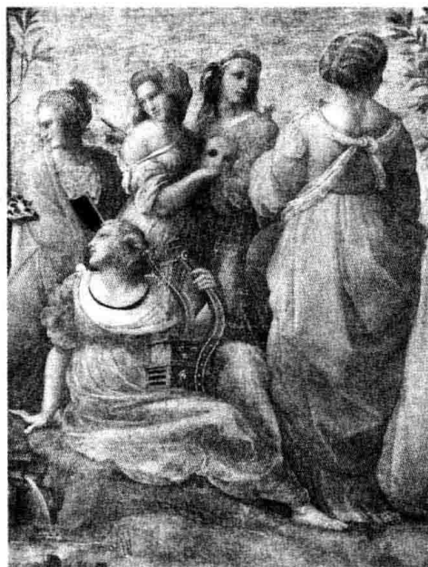
缪斯是古希腊神话中科学与艺术女神的总称。缪斯女神的数目不定，有三女神之说，亦有九女神之说

当看到诗神缪斯们站在我的面前，想要帮我遣词造句、抒发情感的时候，她先是愣了一下，接着目光凌厉，厉声说道：“是谁让这些艺伎和这病夫在一起的？她们不仅医治不了他的病痛，还会用甜蜜的毒药，给他雪上加霜。她们这样做，是用情欲的荆棘去毁坏理性的累累果实；她们的目的不是帮助他解除病痛，而是要让他对于现状泰然处之。如果你们和往常一样，只是将一个目