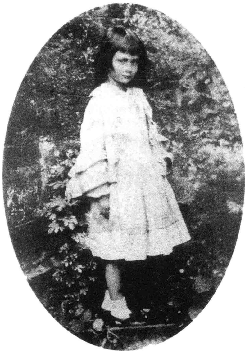
★爱丽丝·利德尔，七岁时。(1859年)