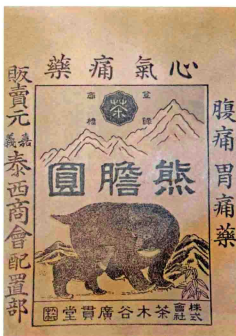
日治時期藥物袋封面 陳光偉教授收藏