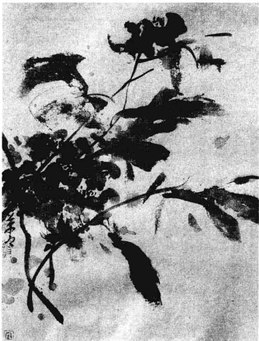
牡丹 2004年 纸本设色 54 × 35cm

此外，研究一个画家有没有大的潜力，能不能成功，不能仅仅就画论画。我比较喜欢研究画背后的那个人。我们接触三年多了，通过跟他的来往，我了解的是这样的：他原来的画和书法，是河南“墨海弄潮”第二批的，很早就取得了成功。他比较豁达、聪慧，书法底子宽博，然后他再专注在画上，那就不一样了，这说明了画上有书法的底气，而