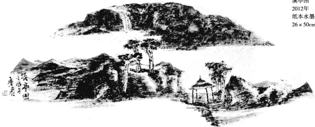
溪亭图 2012年 纸本水墨 26 × 50cm