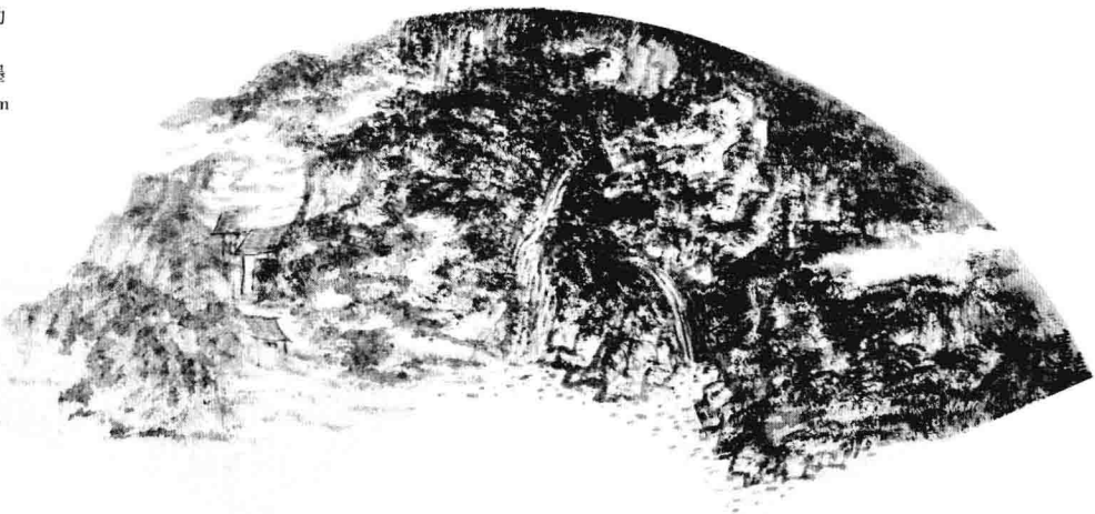
松阁云动 2012年 纸本水墨 26 × 50cm

来，文人士大夫在扇面上挥毫泼墨，尽情溢性，并以精妙之作传赠，渐成社会风尚。若干年后，元人郑元祐感叹道：“宋诸王孙妙磐礴，万里江山归一握。卷藏袖中舒在我，清风徐来袂衣薄。”