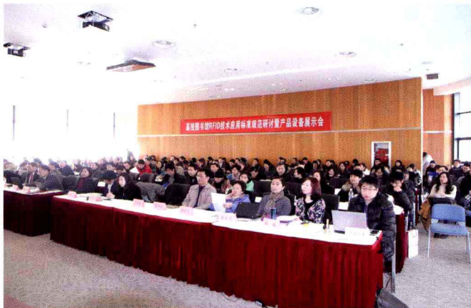
高校图书馆 RFID技术应用标准 规范研讨暨产品 设备展示会