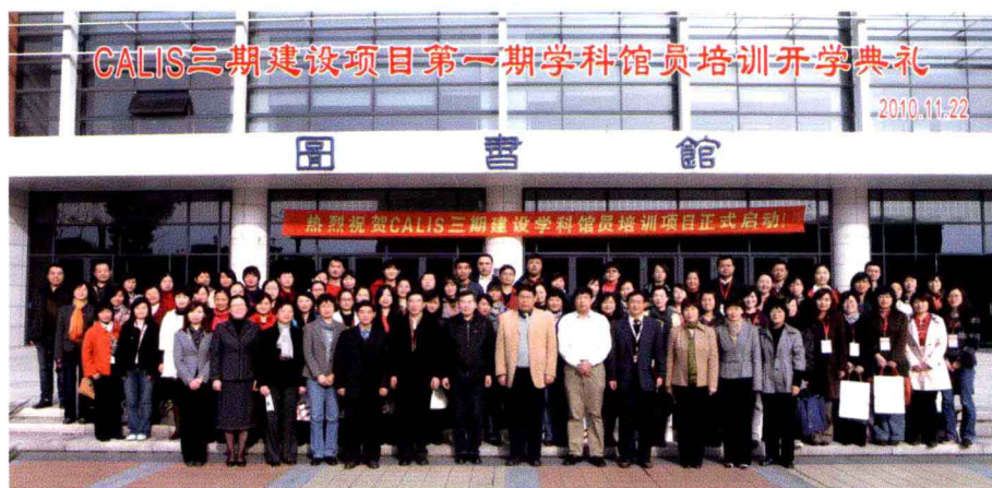
CALIS三期建设学科馆员培训开学典礼大合影