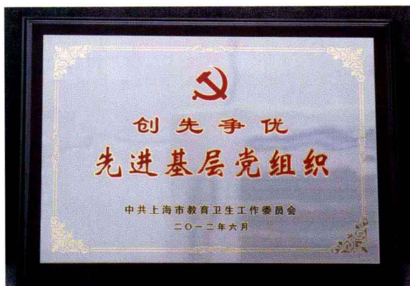
图书馆荣获 创先争优先进基层党组织