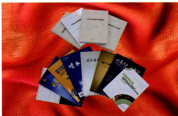
图书馆部分成果展