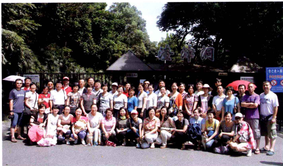
图书馆全体党员参观重庆渣滓洞合影留念