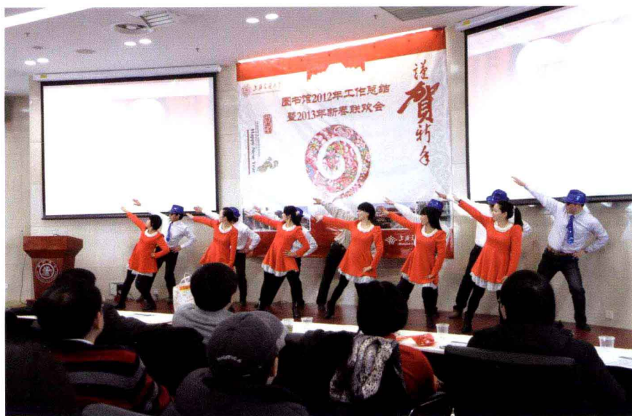
2012年图书馆工作总结大会暨2013年新春联欢会