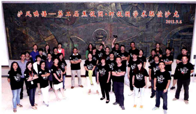
2013年图书馆 焦饭团虾饭团合影