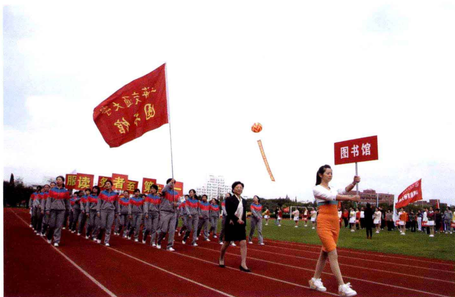
图书馆代表队参加校教工运动会