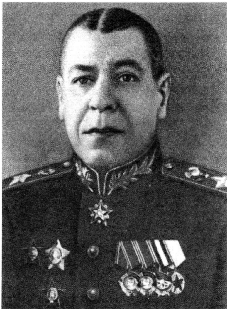
鲍利斯·米哈依洛维奇·沙波什尼科夫元帅