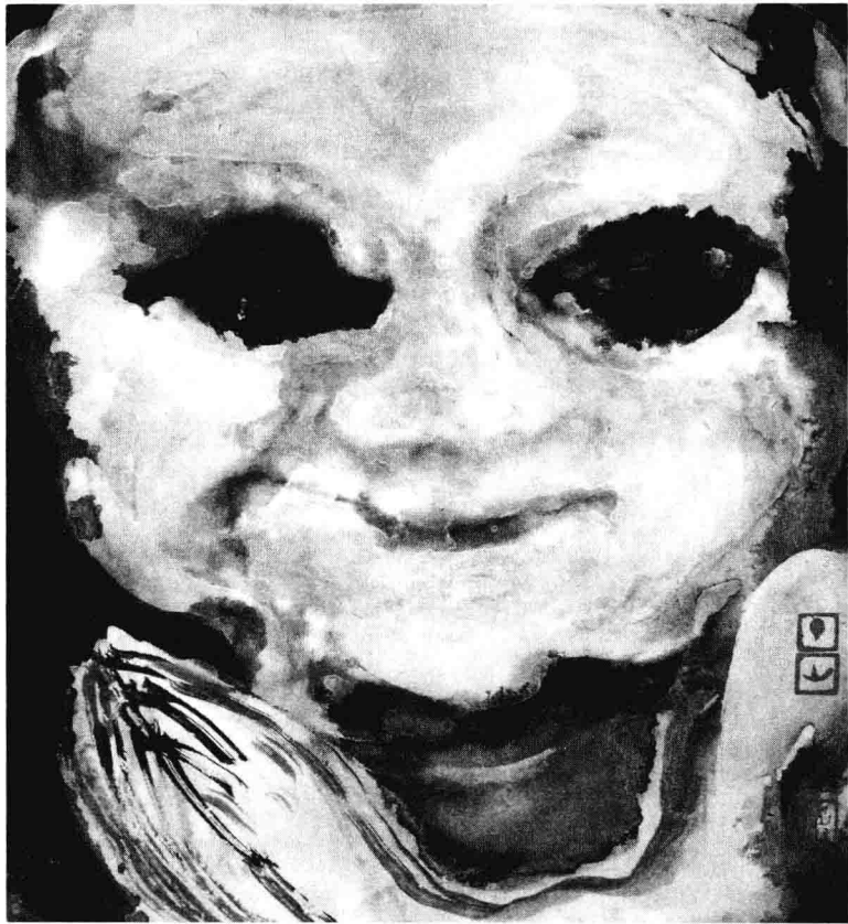
丁山作品:混沌的世界 09