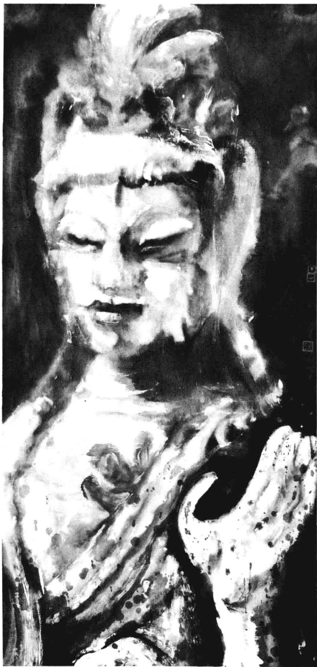
丁山作品：混沌的世界·佛头 水墨纸本，45×45cm，2010年