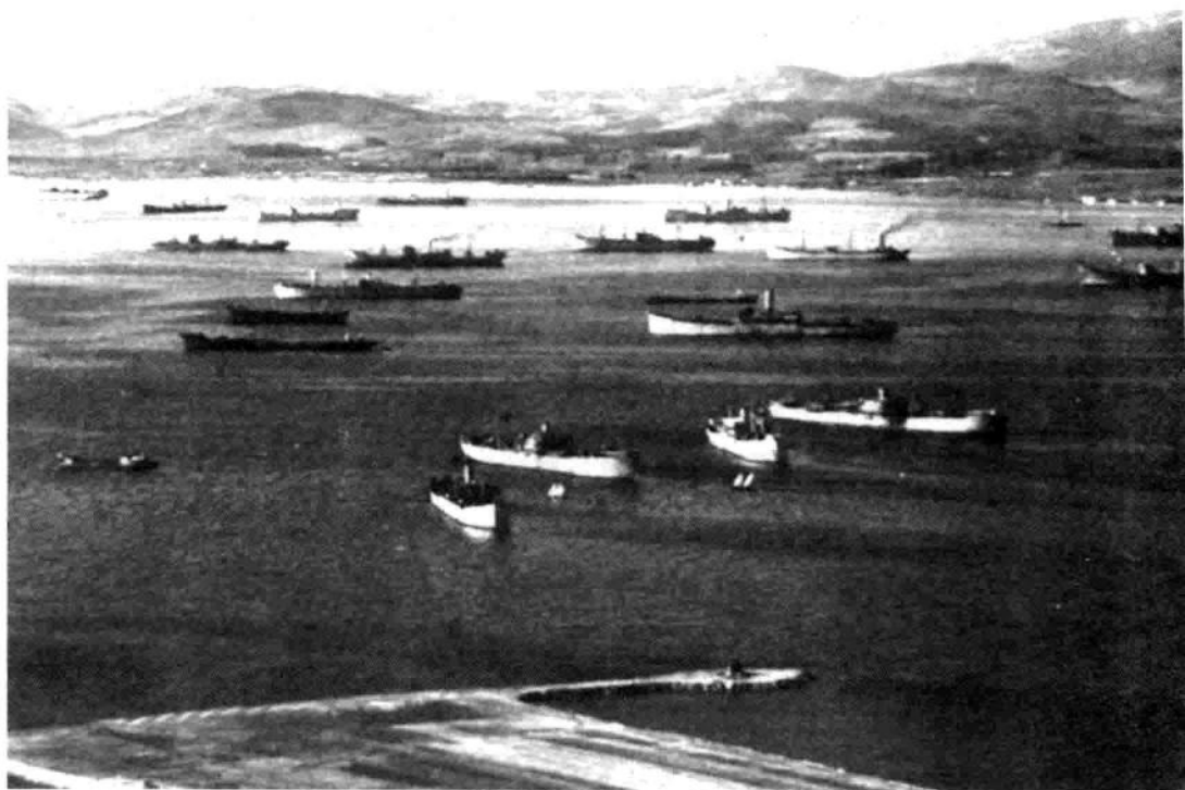
在直布罗陀海峡附近游弋的英国船队