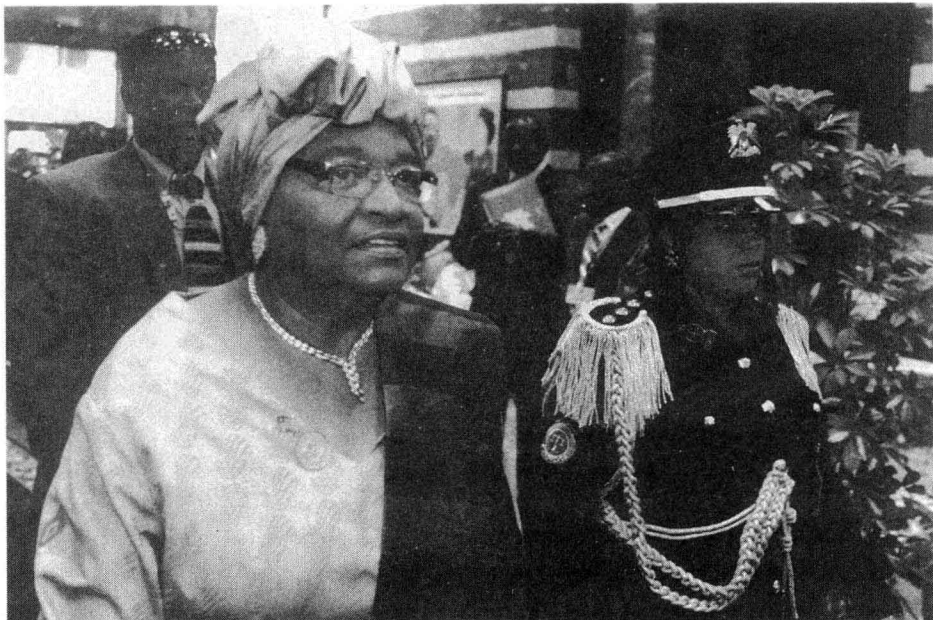
利比里亚总统埃伦·约翰逊-瑟利夫 2009 年参加非洲联盟会议的活动。

己的影响力试图劝阻民主党政治家不要出现在史蒂芬·科尔伯特的“科尔伯特报告”里。你的策略是清晰的，你知道科尔伯特有大约 120 万名观众以及拥有把政治家拖入尴尬境地的令人不可思议的技能。你还记得，科尔伯特曾问过伊利诺伊州众议员菲尔·哈尔，“如果你能使国会的哪个人不被遗忘，那会是谁呢？”你知道，科尔伯特要求佐治亚州共和党人林恩·威斯特摩兰（他是要求把十大诫命张贴在该国首都的提案发起人之一）背诵所有十大诫命，但林恩只能想起三个。你还记得，科尔伯特哄骗佛罗里达州民主党人罗伯特·韦克斯勒同意完成下面的句子：“我喜欢可卡因，因为……”作为白宫办公厅主任，你决心用自己的技能推进奥巴马总统的成功，就像此前你试图协助民主党众议员避免出现失误一样。 [1]