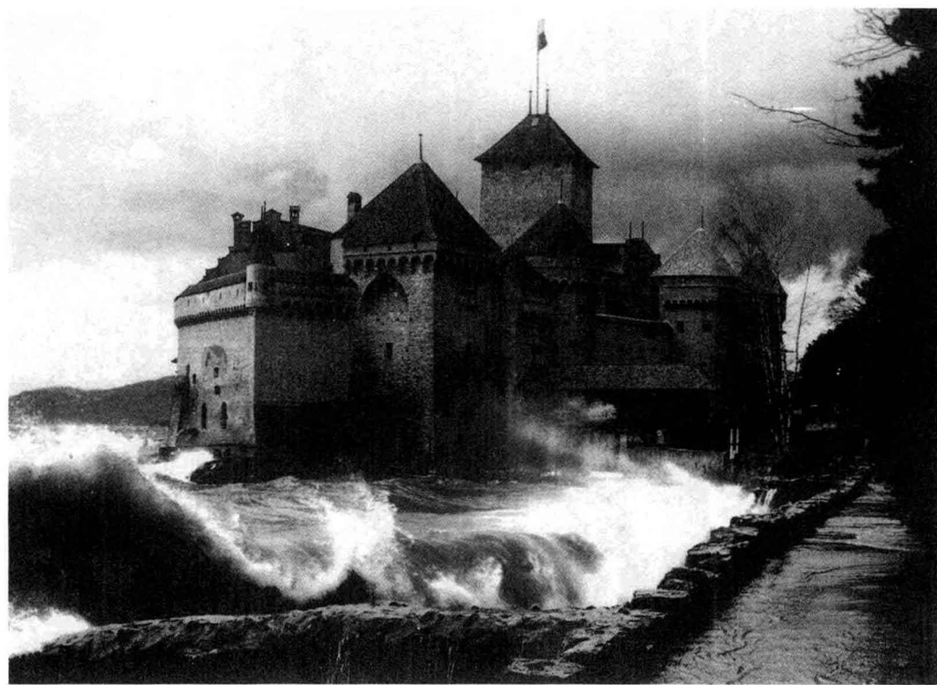
希隆古堡，欧洲最神秘的城堡，由于拜伦的描述，它成了近代第一批旅游者的共同目标。