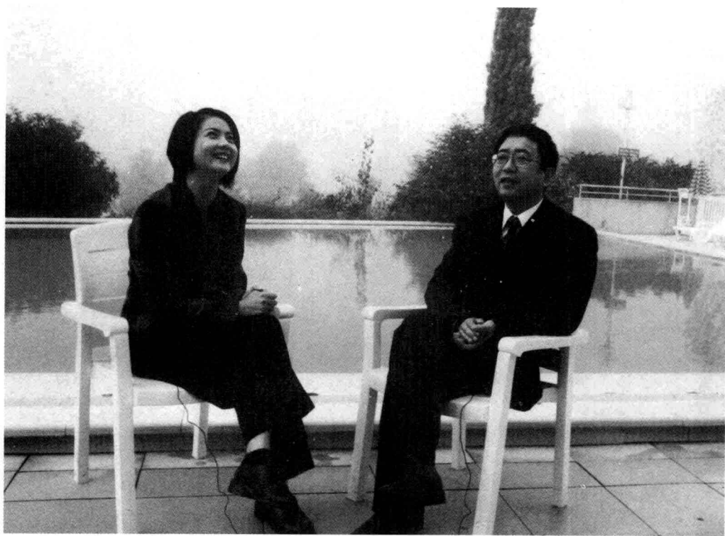
在法国图卢兹，与主持人温迪雅小姐一起做谈话节目。