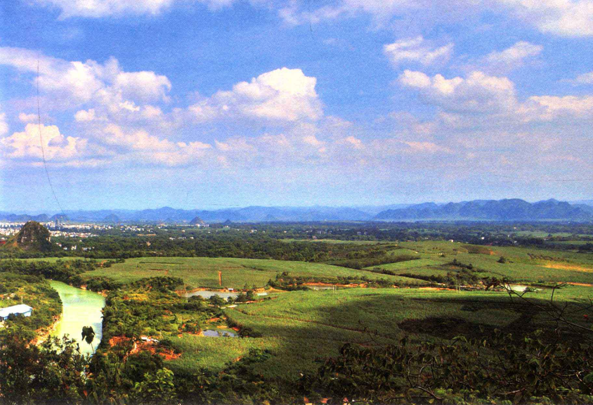
远眺龙州城