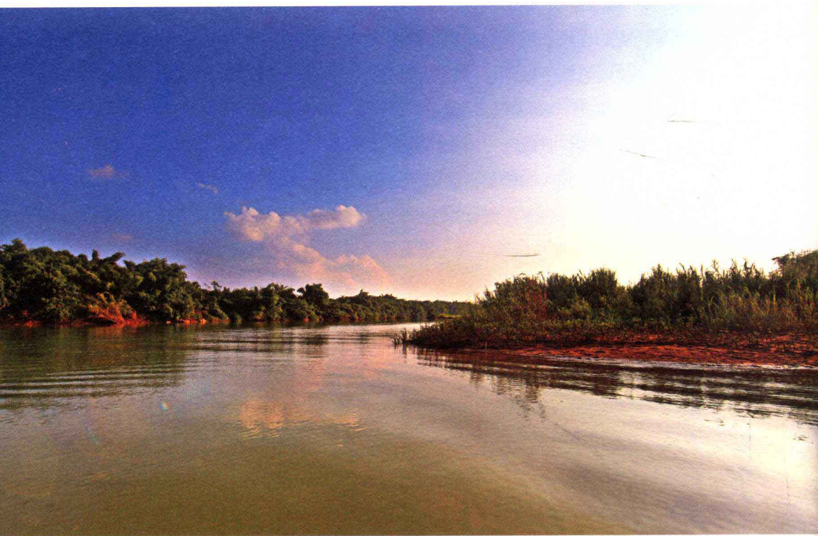
壮丽的江流——丽江