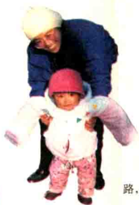
妈妈扶我学走路，真够辛苦的