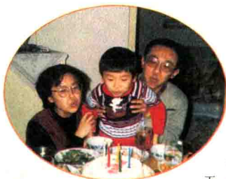
在爸爸、妈妈呵护下，我又长了一岁