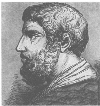
梭伦头像 梭伦是古雅典著名政治改革家和诗人，“梭伦改革”为雅典民主政治的建立奠定了基础，为雅典城邦的振兴与繁荣开辟了道路