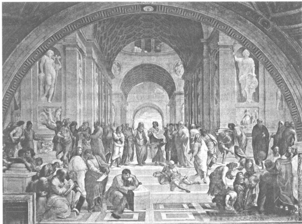
雅典学院壁画 画面以古希腊哲学家柏拉图所建的雅典学院为主题，汇集古希腊不同学派的著名学者，是古雅典“黄金时代”的最佳写照