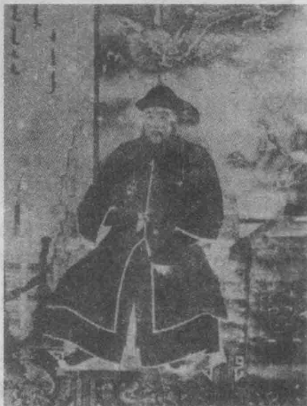
清人所绘《孟古哀像》

史书上记载：当年，努尔哈赤在建州起兵时，叶赫贝勒杨吉对努尔哈赤颇有好感，说：“我有幼女，需其长，当以奉侍。”努尔哈赤问道：“汝欲结盟好，长者可妻，何幼耶？”杨吉说：“我非惜长，但幼女仪容端重，举止不凡，勤为君配耳。”努尔哈赤听后满意地点头称是。这个幼女就是后来有名的孟古。当她的父亲被辽东总兵李成梁所杀，其兄便携其投靠了努尔哈赤，年仅14岁的她成了平衡家族势力的砝码。再后来，因努尔哈赤欲统一女真，叶赫部大为反感，亲家之间的关系越发不和睦。此时，