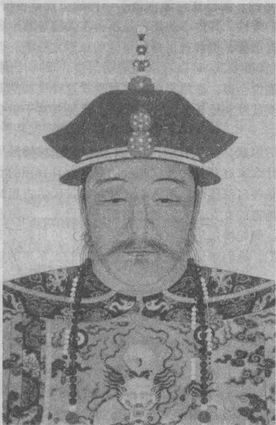
清太祖努尔哈赤（1559—1626）朝服像