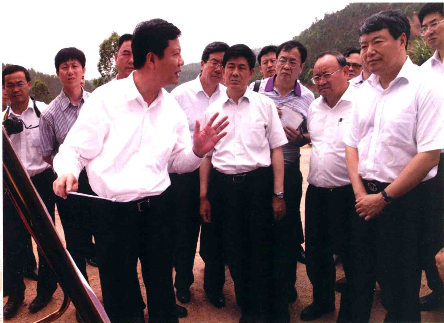
2011年5月，国土资源部党组书记、部长、国家土地总督察徐绍史带领调研组一行，莅临广东进行调研。5月26日，徐绍史在河源市东源县古云村整装勘查区考察当地稀土矿的勘查、开发与集约利用情况。