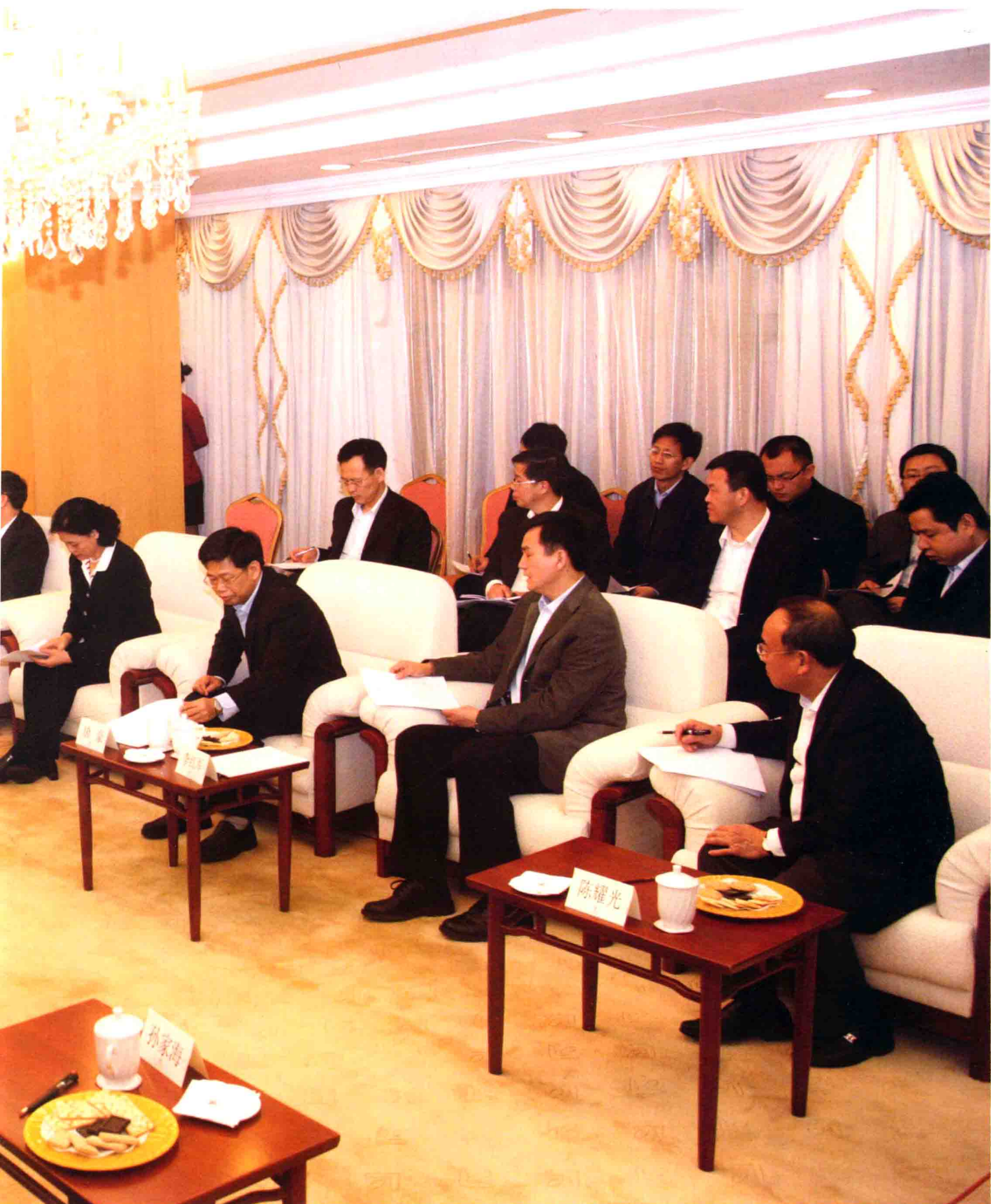
2011年3月13日，中共中央政治局委员、广东省委书记汪洋，广东省副书记、省长黄华华在京会见国土资源部部长、党组书记、国家土地总督察徐绍史，就如何进一步推进广东国土资源管理制度改革、在严格保护和管理资源的同时切实保障广东经济发展等问题进行商谈。省长黄华华、副省长林木声先后汇报广东国土资源管理工作情况。