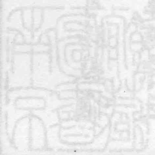
金陵四十八景全圖