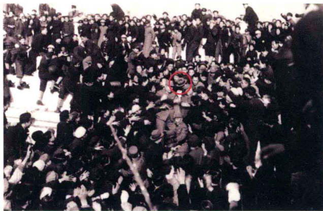
一九四五年十二月十六日 國民政府主席蔣中正（紅圈圈起者）於學生大會會場上訓話完畢，離去時，學生爭相向前致意。