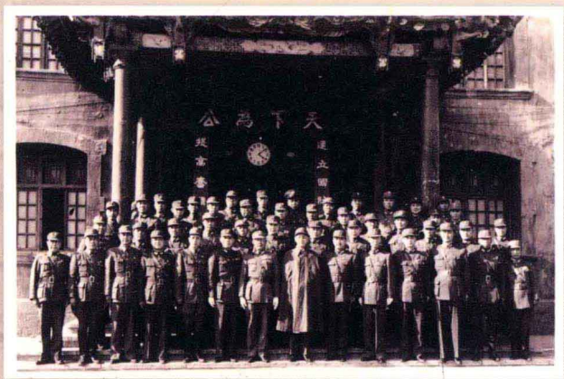
一九四五年三月二十四日 國民政府主席蔣中正與陸軍總部及遠征軍 高級將領合照。