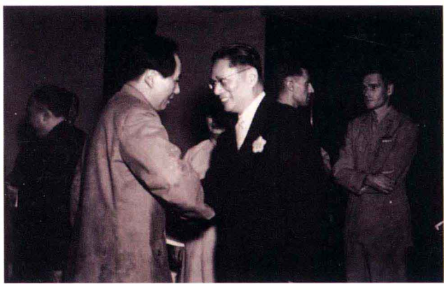
一九四五年十月十日 行政院長宋子文（右）與中國共產黨中央委員會主席毛澤東（左），於協商會議結束後，雙方代表簽字握手，賀雙十會談成功留影。翌日，毛澤東返回延安。