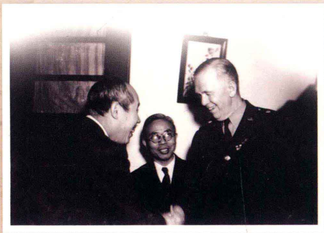
一九四五年十二月二十三日 外交部長王世杰（中），為美國駐華特使馬歇爾（右）引見中國共產黨代表董必武（左），雙方握手合影。