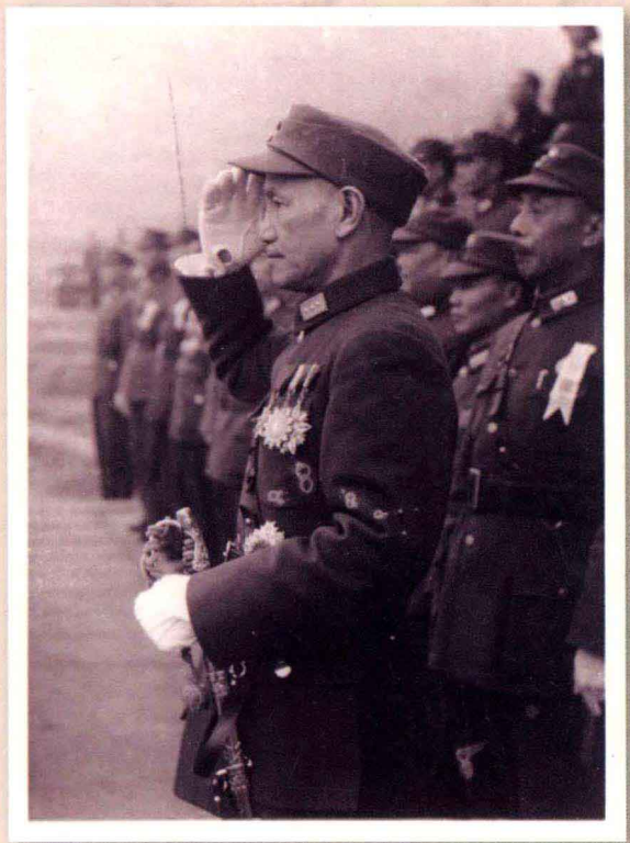
一九四五年一月一日 國民政府主席蔣中正於元旦校閱部隊。