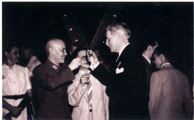
一九四五年九月三日 國民政府主席蔣中正於慶祝世界勝利日酒會中，與美國駐華大使赫爾利（右）舉杯慶祝聯合國日。