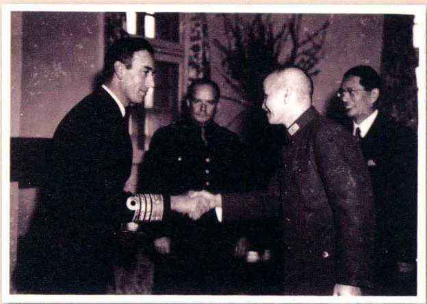
一九四五年三月九日 國民政府主席蔣中正接見東南亞盟軍總司令蒙巴頓將軍（左），並贈授特種大綬雲 麾勳章，以酬其打通中印公路功績。