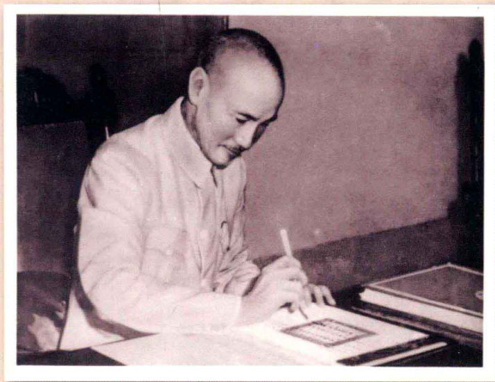
一九四五年八月二十四日 國民政府主席蔣中正於《聯合國憲章》簽署典禮簽字。

簽署聯合國憲章，為世界史的大事。 中華民國正式成為世界五強之一。 蔣公為中華民族尊嚴所作貢獻之歷史地位， 在聯合國憲章中永不會磨滅。