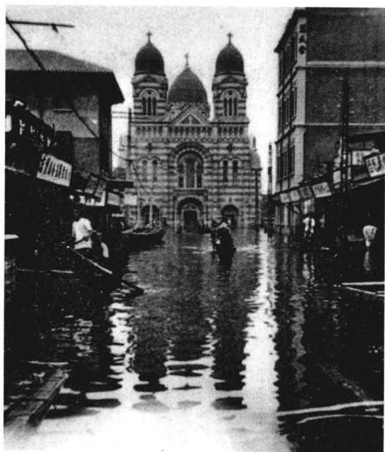
天津卫遭受洪灾情景