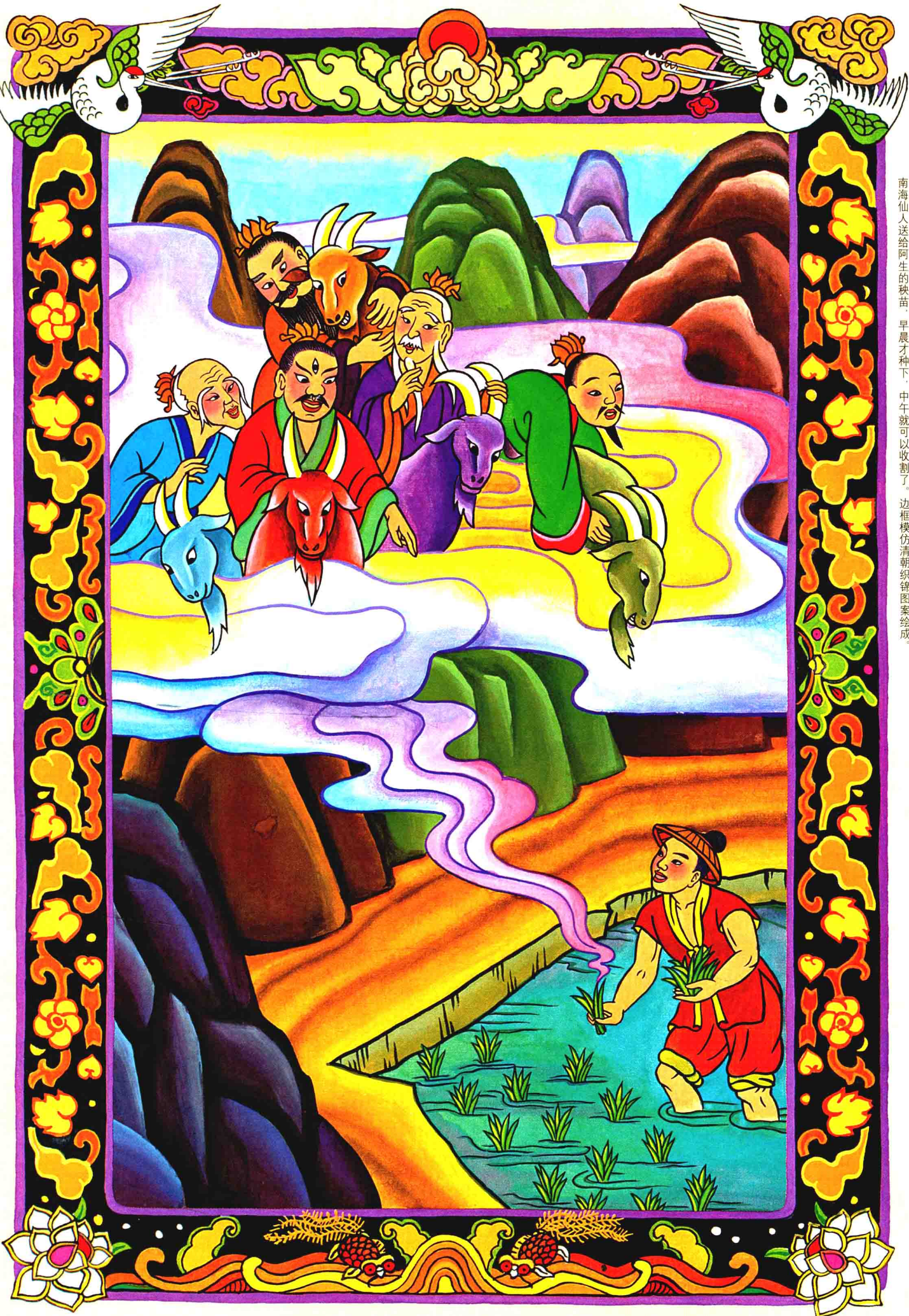
南海仙人送给阿生的秧苗，早晨才种下，中午就可以收割了。边框模仿清朝织锦图案绘成。