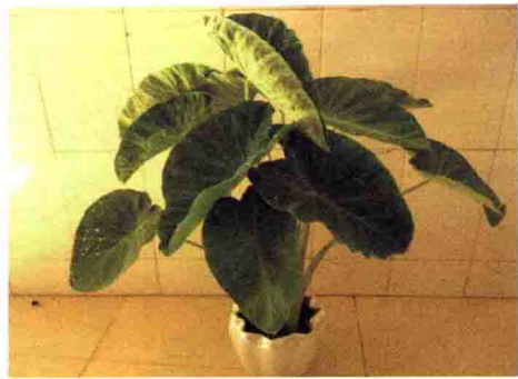
④ 滴水观音 OR 芋头?