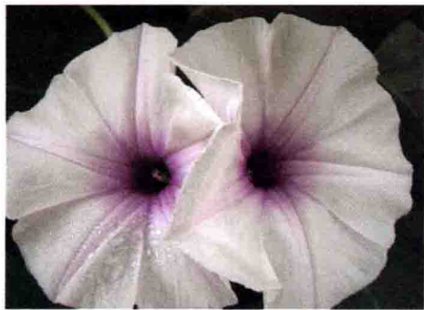
① 牵牛花 OR 空心菜花？