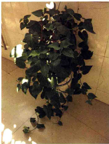
⑤ 绿萝 OR 薯叶?