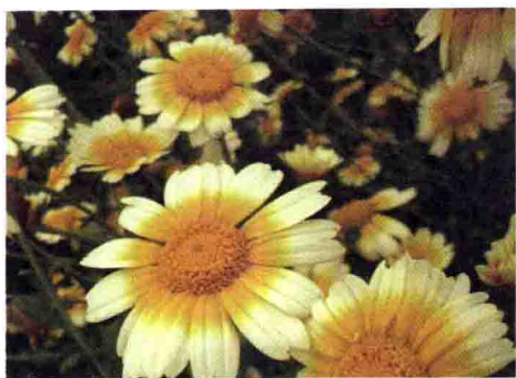
③ 菊花 OR 茼蒿花?